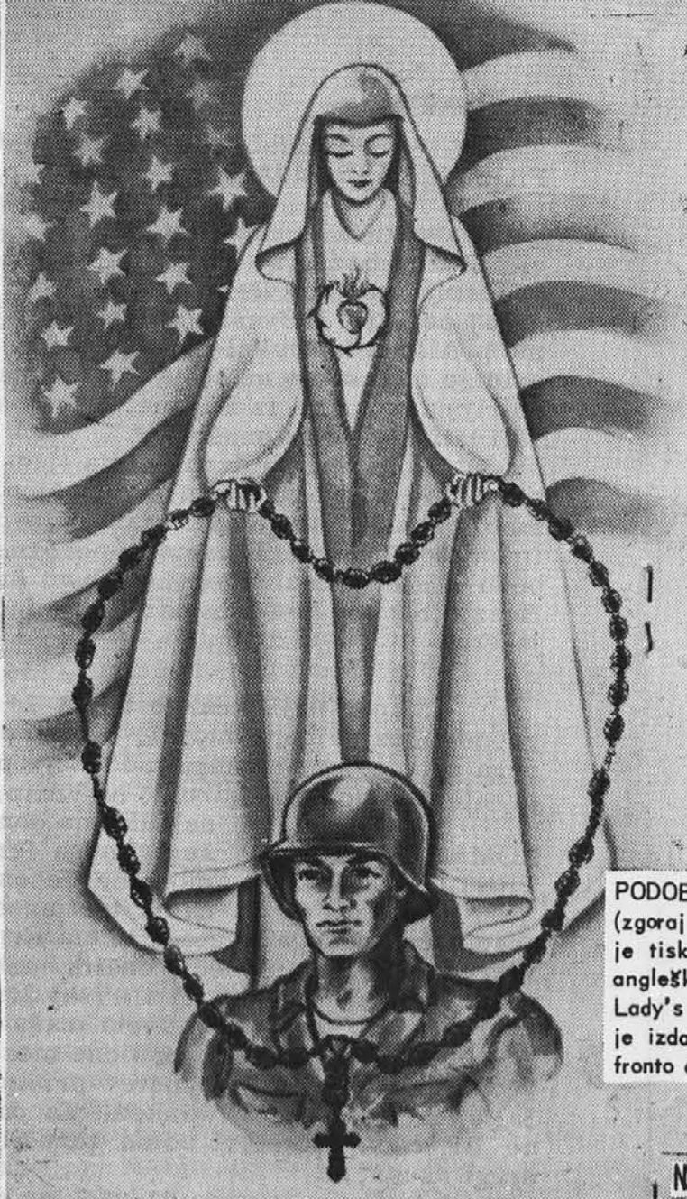
PODOBA FATIMSKE GOSPE (zgoraj na levi) z rožnim vencem je tiskana na platnicah novega angleškega molitvenika 'Our Lady's Crusade for Peace'. Izšla je izdaja za vojake in druga za fronto doma.