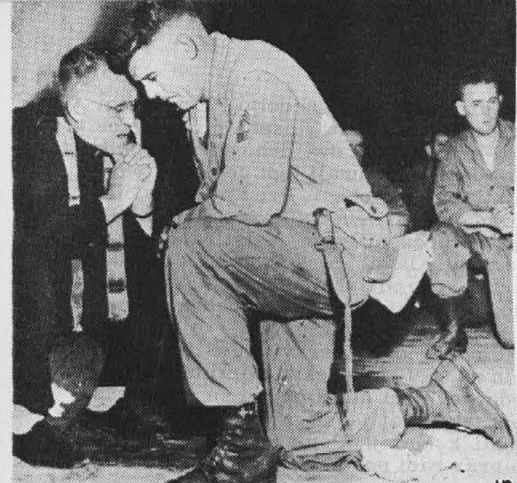
DVE SLIKI S KOREJE. Gornja predstavlja ameriškega misijonarja, ki spoveduje na bojni fronti vojake. Spodnja slika pa kaže ameriškega vojaškega kaplana, ko deli vojakom sveto obhajilo.