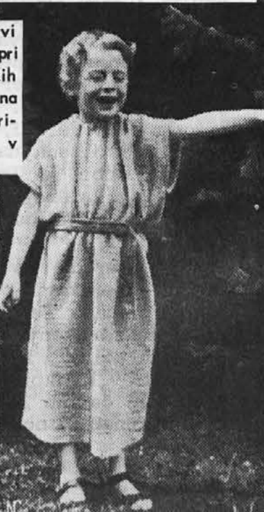
DEČKO na desni je prvi Amerikanec, ki je igral pri svetovnoznanih pasijonskih igrah v Oberammergau na Bavarskem. Je sin ameriškega oficirja, ki služi v Nemčiji.