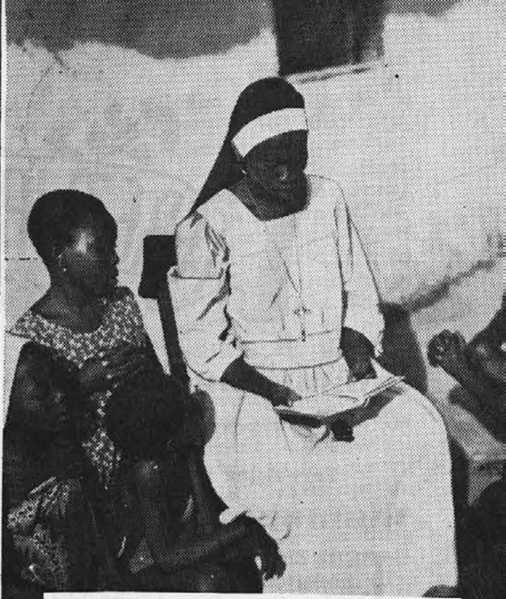
V BELGIJSKEM KONGU imajo že domače sestre misijonarke, ki otroke uče katekizem. Slika je iz vasi Banzyville.