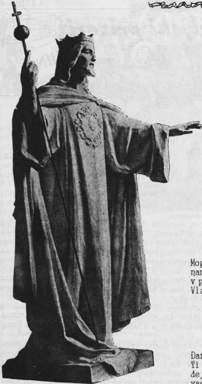
Kristus Kralj (iz muzeja »Hieron«)

Mogočno se dvigni nam spev iz srca, v pozdrav Rešeniku, Vladarju sveta!