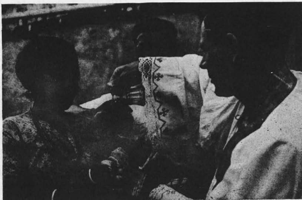
KRST V AFRIKI