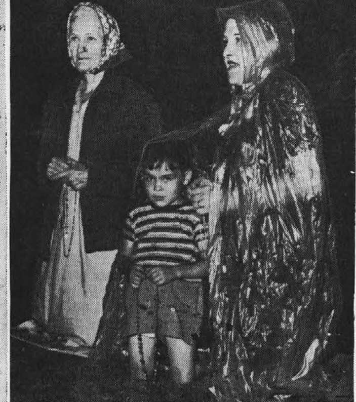
ROŽNI VENC molijo vsak dan za spreobrnjenje Rusije in za mir prebivalci mesta St. Cloud, Minn. Tudi dež jih ne zadrži od lepe navade. Deček se seveda skriva pod materinim dežnim plaščem.