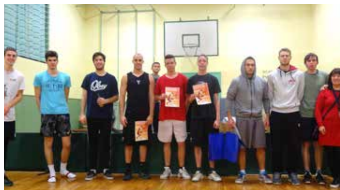
Podelitev najboljšim trem ekipam.

V soboto, 25. novembra 2017, je Mladinski center Mengeš v športni dvorani Partizana organiziral košarkarski turnir trojk. Kljub slabemu vremenu se je turnirja udeležilo veliko košarkarjev iz Mengša in okolice.