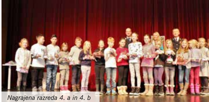
Nagrajena razreda 4. a in 4. b