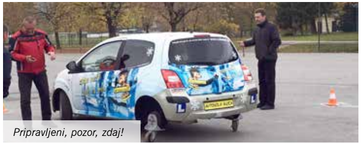
Pripravljene, pozor, zdaj!

Besedilo in foto: Renato Osolnik, predsednik AMD