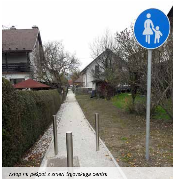
Vstop na pešpot s smeri trgovskega centra

S samo izvedbo, gradnjo pešpoti od igrišča na Hribarjevi ulici do bližnjega trgovskega centra, je Občina Mengeš začela v mesecu oktobru. V sklopu projekta je občina uredila odvodnjavanje, zgradila robnike in nasula pesek. Na začetku in koncu povezovalne peš poti so bili postavljeni količki, ki bodo preprečevali divjo vožnjo s kolesi ali motorji. Dela so bila zaključena konec oktobra.