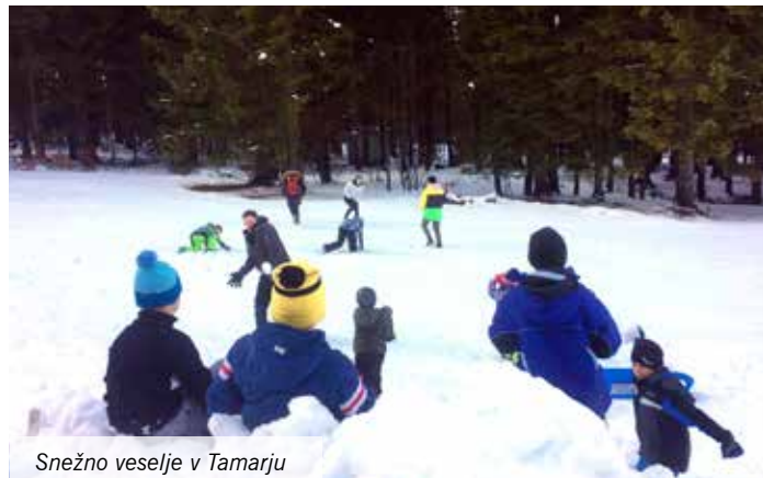
Snežno veselje v Tamarju

Taborniki smo včerajšnjo sončno soboto izkoristili za rodov sankaski izlet v Tamar, katerega so se tokrat udeležili tudi starši otrok. Na pot smo krenili že v zgodnjih jutranjih urah in se s tem izognili gneči sprehajalcev in pohodnikov, ki so se nerodno umikali nam, sankacem, ko smo drveli po klanecu navzdol. Toda pred spustom je bilo najprej treba sani spraviti na sam vrh, do doma v Tamarju.