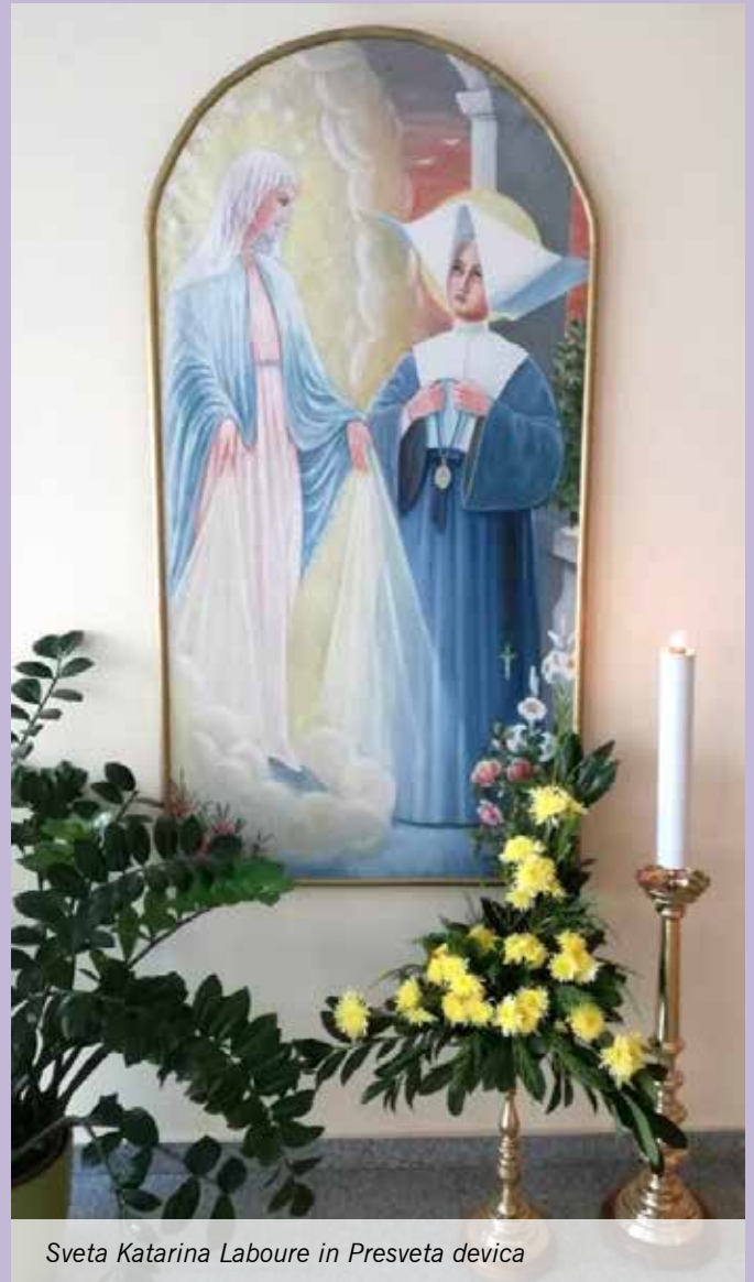
Sveta Katarina Laboure in Presveta devica

Besedilo: Miha Šimnovec