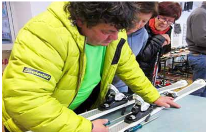
Strokovna pomoč na sejm rabljene opreme

Smučarji vam v novem letu 2018 želimo predvsem zdravja ter veliko poslovnih in osebnih uspehov.