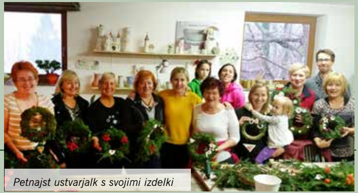
Petnajst ustvarjalk s svojimi izdelki