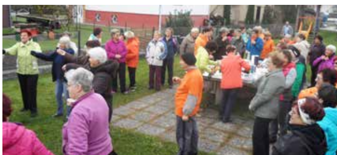
Na obletnico so povabili tudi skupino Oranžerija in skupino Loka

Besedilo: Majda Golob, vodja skupine Mali Mengeš