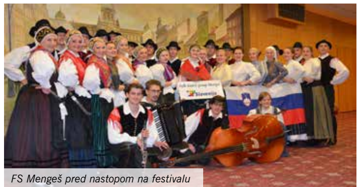
FS Mengeš pred nastopom na festivalu

Praga, kulturno središče Češke z bogato zgodovino, nekdanje tretje največje mesto v Evropi, ki se ponaša z znamenitostmi kot so Hradčani in Mala strana, kjer na bregu nad Vltavo kraljuje Praški grad s stolnico Svetega Vida, slikovit in mogočen Karlov most, ki nas z gradu popelje v Staro mesto z astronomsko uro na mestni hiši, staromestni trg z gotskimi in baročnimi stavbami in mesto, ki ga je bogato zaznamoval tudi naš arhitekt Jože Plečnik.