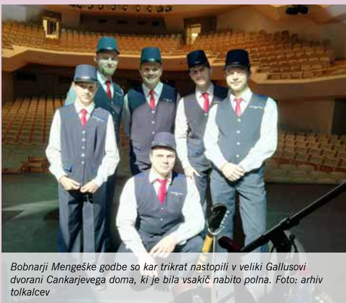
Bobnarji Mengeške godbe so kar trikrat nastopili v veliki Gallusovi dvorani Cankarjevega doma, ki je bila vsakič nabito polna.