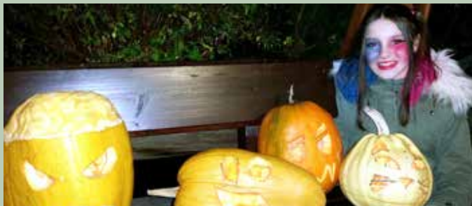
Razstavljenih je bilo več kot 30 različnih bučnih obrazov

Tudi letos smo Turistično društvo Dobeno in Kmečki turizem Blaž, v torek, 31. oktobra, na večer čarovnic ob 17. uri, že tradicionalno skupaj organizirali veseli družabni dogodek za otroke in odrasle. Izrezovanje različnih obrazov v bučah, veselih, žalostnih, strašljivih in šaljevih, to je bilo prepuščeno domišljiji ustvarjalcev.