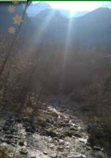
Avtorica fotografije z naslovom Razlikovanje je Regina Bokan