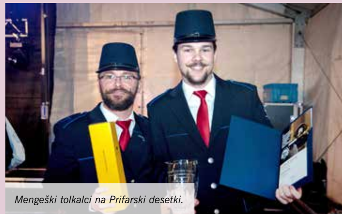
Mengeški tolkalci na Prifarski desetki.