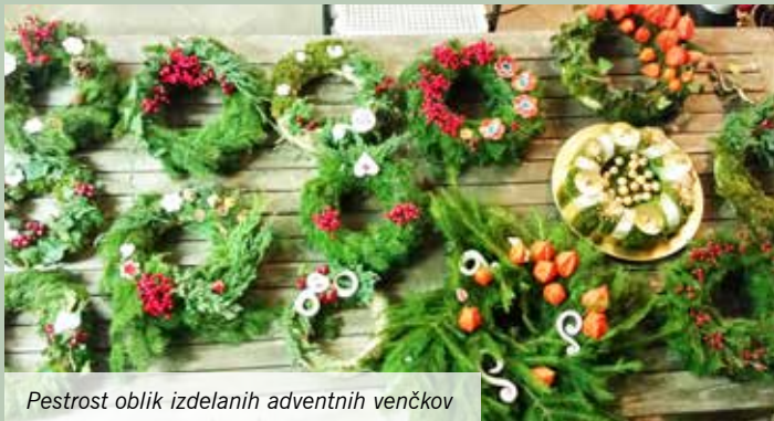
Pestrost oblik izdelanih adventnih venčkov