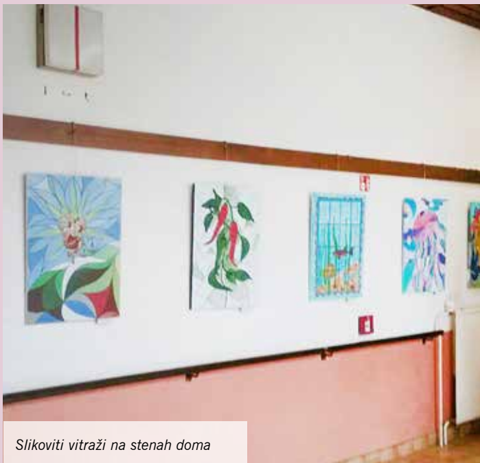
Slikoviti vitraži na stenah doma