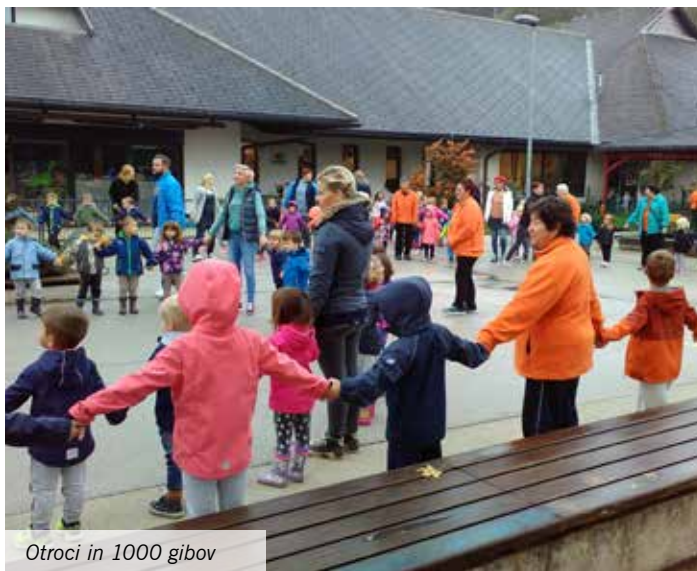
Otroci in 1000 gibov