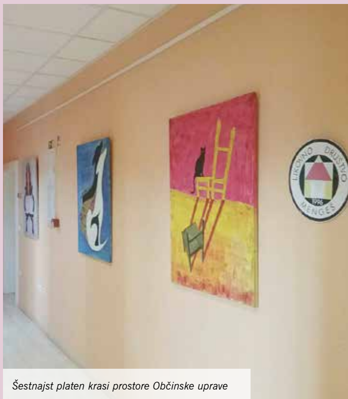
Šestnajst platen krasi prostore Občinske uprave