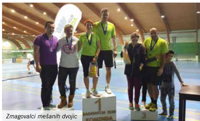
Zmagovalci mešanih dvojic