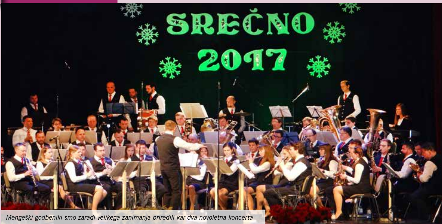
Mengeški godbeniki smo zaradi velikega zanimanja priredili kar dva novoletna koncerta