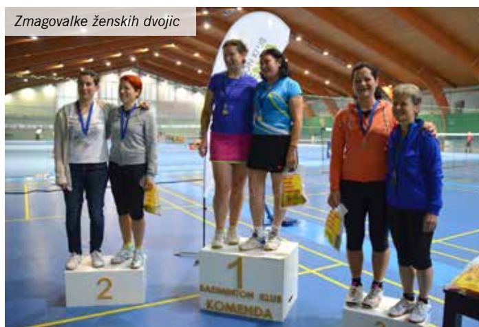
Zmagovalke ženskih dvojic