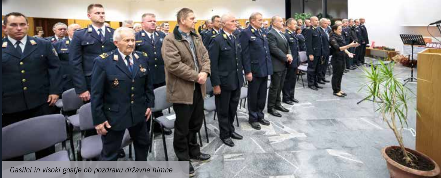
Gasilci in visoki gostje ob pozdravu državne himne