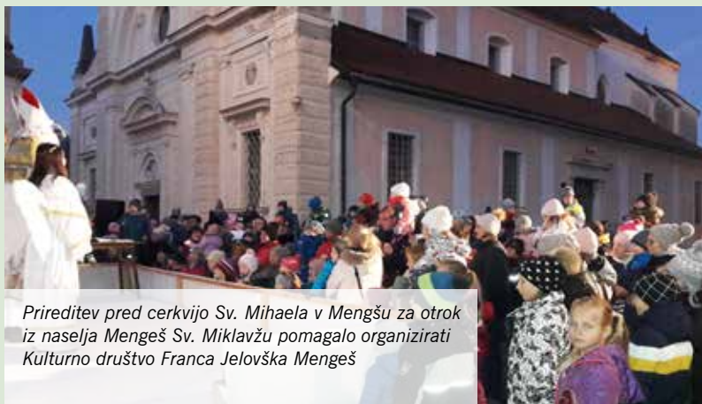
Prireditve pred cerkvijo Sv. Mihaela v Mengšu za otrok iz naselja Mengeš Sv. Miklavžu pomagalo organizirati Kulturno društvo Franca Jelovška Mengeš