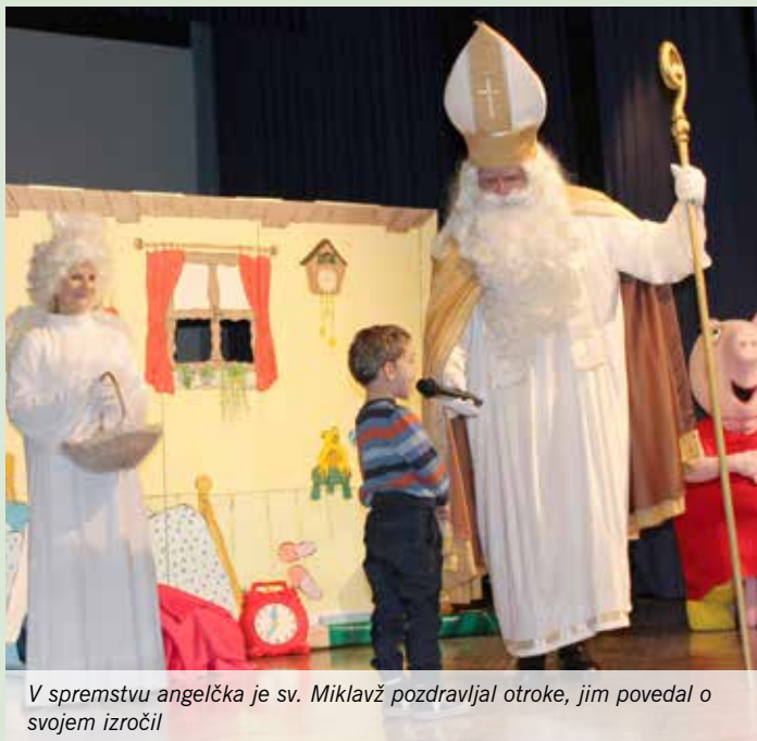
V spremstvu angelčka je sv. Miklavž pozdravljal otroke, jim povedal o svojem izročilu

Otroci iz rejniških družin so skupaj z otroki in vnuki članov Rotary kluba Domžale preživeli prelep Miklavžev večer, v torek 5. decembra 2017, v Kulturnem domu Janka Kersnika v Lukovici.