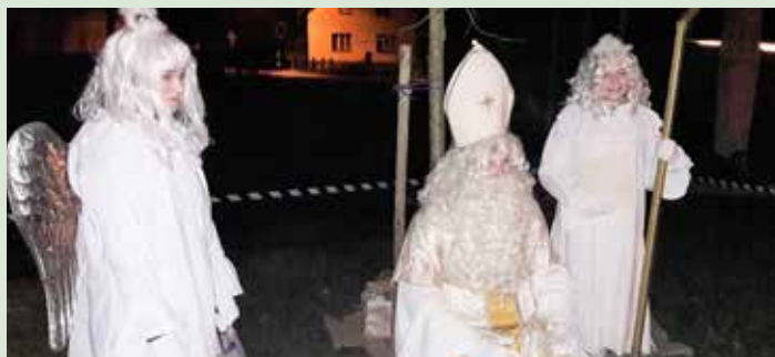
Prireditve ob kamnitem mostu za otroke iz naselja Loka pri Mengšu je Sv. Miklavžu pomagalo organizirati Kulturno društvo Antona Lobode Loka pri Mengšu