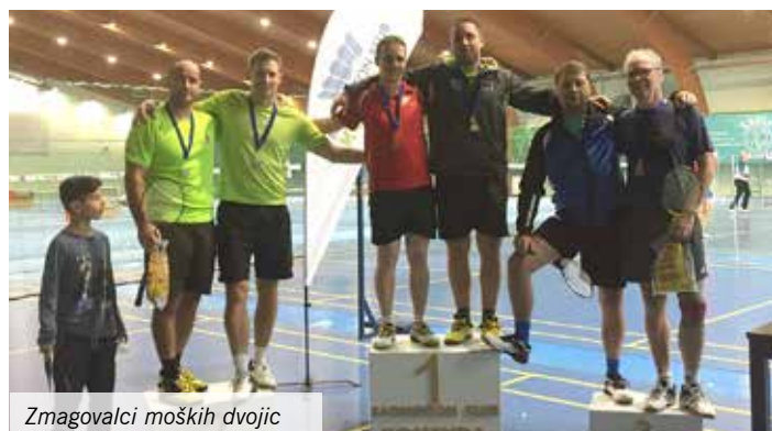
Zmagovalci moških dvojic