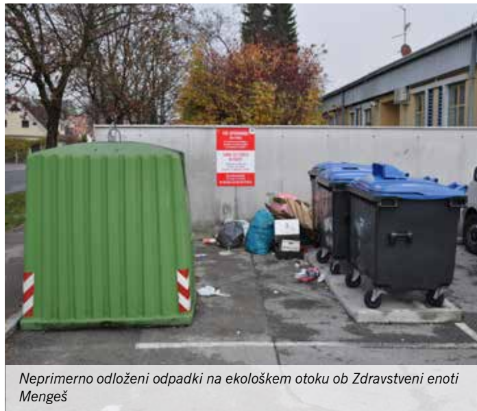
Neprimerno odloženi odpadki na ekološkem otoku ob Zdravstveni enoti Mengeš