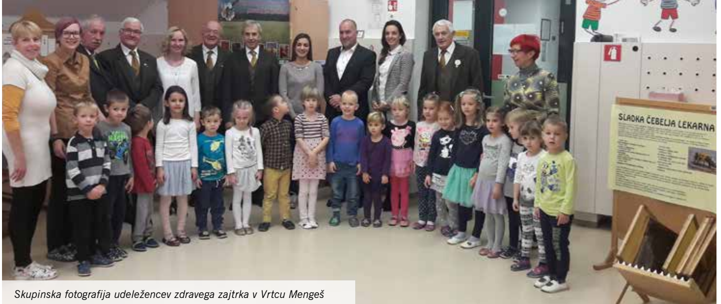
Skupinska fotografija udeležencev zdravega zajtrka v Vrtcu Mengeš