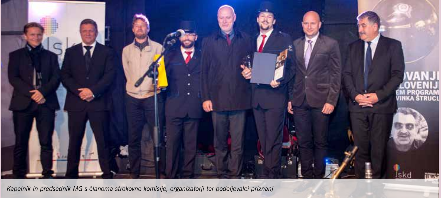
Kapelnik in predsednik MG s članoma strokovne komisije, organizatorji ter podeljevalci priznanj