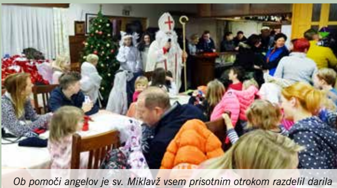
Ob pomoči angelov je sv. Miklavž vsem prisotnim otrokom razdelil darila

Tudi letošnje leto je turistično društvo Dobeno skupaj s turistično kmetijo »Blaž« in finančno pomočjo občine Mengeš organiziralo eno najbolj obiskanih prireditev v kraju, tradicionalni obisk Miklavža na Dobenu. Sneg, ki je zapadel nekaj dni pred prihodom dobrega moža je nadel Dobenu idilično, zimsko podobo. Jasno nebo nad vasjo nam je v dneh pred Miklavžem podarilo barvito zoro in oranžno zarjo, saj je Miklavž cele noči pekel piškote za pridne otroke.