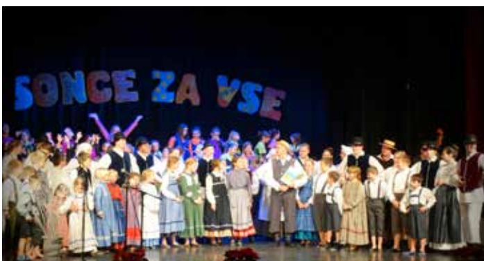
Tudi na letošnji prireditvi Sonce za vse, so ob polni dvorani nastopili mnogi izvajalci, ki so se za svoj nastop odpovedali honorarju

Besedilo in foto: Mojca Reven, podpredsednica UO