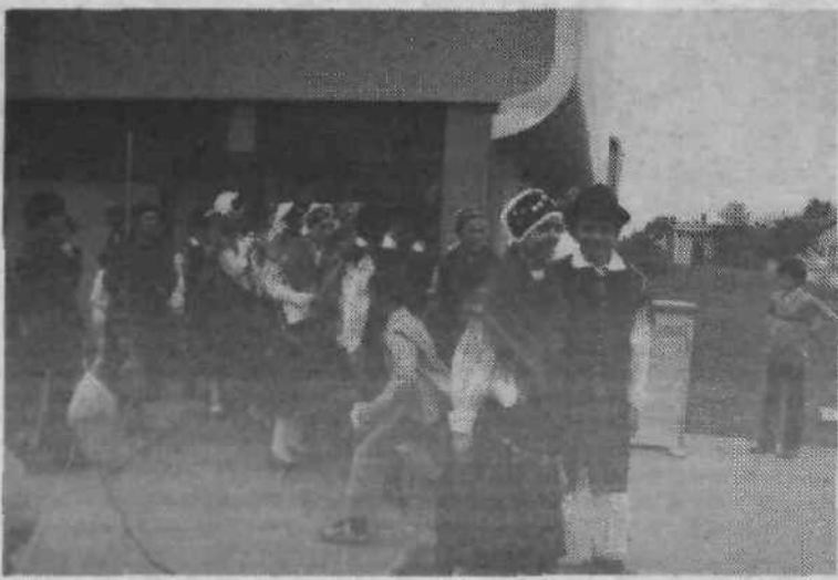
2 / ZBOR OBČANOV

Ob 80 letnici Zavoda za usposabljanje slušno in govorno prizadetih v Ljubljani je bila v Bežigradski galeriji od 25. do 28. avgusta privlačna razstava. Z likovnimi izdelki so se predstavili slušno prizadeti otroci. Za razstavo je bilo med Bežigradčani precejšnje zanimanje.