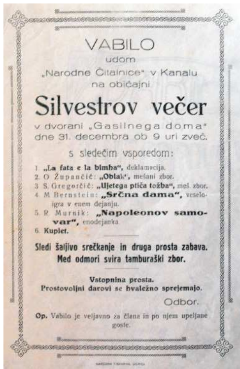
Vabilo na silvestrovanje 1926 (PANG).

Po letu 1880 se je javno delovanje glede na prvo desetletje precej zmanjšalo. Že decembra 1881 je dopisnik iz Kanala v časopisu Soča poročal o pomanjkanju novih članov in ukinitvi pevskega zbora. 16 Podobno je opozarjal članek novembra dve leti kasneje. »Vse narodno življenje na Kanalskem je v ranjkeji kanalskeji čitalnici. Da bi ista še živela, ne verujem, ker o njej uže dolgo časa—par let — ni ne duha ne sluha. /.../ Kanalci, spomnite se pretečenih let, lotite se zopet dela, nadaljujte, kakor ste bili pričeli, in cel okraj bo po naravni poti posnemal vaš izgled.« 17 Članek je spodbudil Kanalce, ki so 30. decembra 1883 izvolili nov odbor, ki je sklenil pripraviti poučna predavanja s tombolo in petjem. 18 Kljub ponovnemu zagonu so prvo prireditve pripravili šele 19. septembra 1886.