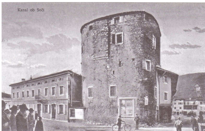
Hotel »Pri zlatem levu« (Kanal ob Soči)

Od tega je minila doba let dolgih trideset in pet, življenje je vstalo iz groba: Čitalnica je vzniknila v svet!