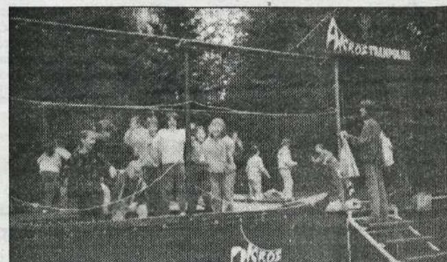
V Arboretum Volčji potok vsak dan prispe avtobus učencev iz različnih slovenskih šol, ki se v okviru naravoslovnih dnevov seznanjajo z življenjem rastlin in živali, vmes pa najdejo čas tudi za skoke na »trampolinju«.