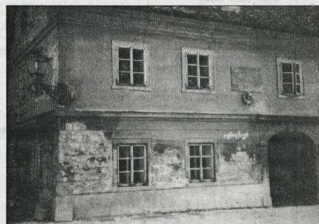
V okviru priprav na praznovanje novega občinskega praznika že potekajo priprave za obnovo Maistrove rojstne hiše na Šutni, ki nam v sedanjem stanju res ne more biti v čast. (fs)