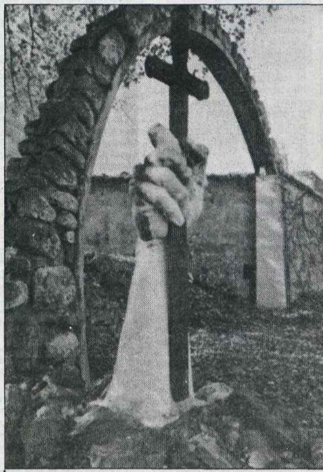
»MRTVI ŽIVE ŽIVETI UČE«, je zapisano na oboku spomenika žrtvam 1. svetovne vojne na Žalah. Na njem je vklesanih 60 imen kamniških fantov, ki so v letih 1914-1918 padli na frontah takratne Avstroogrske. (fs)