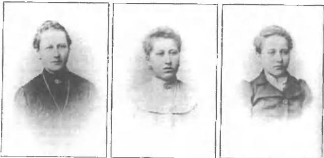
Gregčeva dekleta, slikana ok. leta 1900 - preden so šle po sveto.

smo nabirali kislice, v gozdu gozdne jagode in borovnice, na vrtu pa predvsem jabolka. Pomarančo sem okusila prvič leta 1951, ko je prišla na obisk teta iz Amerike. Tudi igrače nismo imeli; igrali smo se s škatlicami od kreme za čevlje. Nabirat smo hodili borovnice in celo majske hrošče – kebre, in jih prodajali, denar pa smo porabili za šolske potrebščine. Takrat nismo imeli niti radijskega sprejemnika niti drugih razvedrilnih naprav; tako je