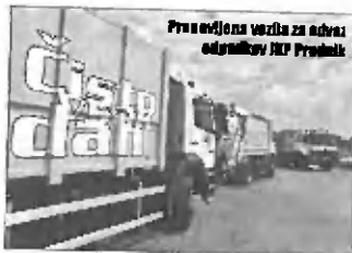
Prenovljeno vozilo za odvoz odpadkov IUP Prodnik

Domžalsko komunalno podjetje Prodnik d.o.o., ki odvažja odpadke iz občin Domžale, Trzin, Mengeš, Lukovica in Moravče, je z naložbami, izpeljanimi konec lanskega leta, saniralo odlagališče odpadkov na Dobu, z nedavno