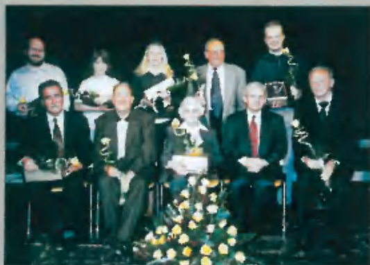
Dobitniki občinskih nagrad v letu 2003