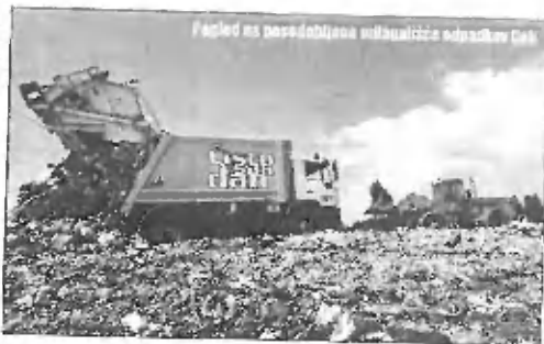
Pogled na posodobljeno odlagališče odpadkov Dob