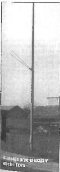
Kandelaber ob nekdanji meji v občini Trzin