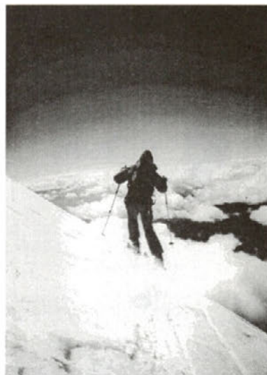
Na višini okrog 6000 m pričnem svoj spust in brez spoštovanja višine elegantno vijugam na trdem snegu