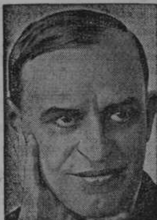
Svetozar Pribičević †.

sprejeli načela boljševiške propagande; naj se pridružijo samo njegovemu praktičnemu delu na gospodarskem in socialnem polju. Kakor da bi bilo mogoče ločiti gospodarski red od moralnega reda in sodelovati na praktičnem polju s to pogubno zmoto brezbožnega socializma, ne da bi se navzeli njegovega brezbožnega nauka! Ta propaganda se je kakor volk preoblekla v ovčjo kožo, hlinič nekako strpnost do katolicizma samo za to, da prevari in razoroži kristjane in ves svet, da bi ga lažje razrušila. To vidimo sedaj na zgledu Španije, kar je pač izmodrilo vse katoličane, ne pa še ostalega sveta.