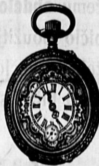
Št. 505. Prava srebrna cilindreremontoar, trpežno kolesje in močni pokrovi, gld. 485, ista z dobrim ankerkolesjem gld. 595 in naprej.