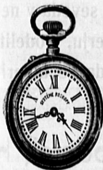
Št. 502. Nikelnasta ankerremontoar-Roskopf, trpežno kolesje, gld. 245, enaka iz pravega srebra gld. 395, ista z dvojnatis tršim srebrnim močnim pokrovom gld. 650 in naprej.

Moške ure, 2 tretjini naravne velikosti.