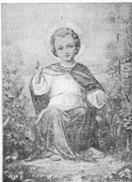
Jezušek, čuvar i pláča patircov.

V šoli ste se včili, ka je nedužen Abel pastir bio. To vas že menje zná, ka je Abraham, očák Israelov, túdi pastir bio: z toga je živo, ka je šo z svojimi čredami od edne paše do drúge. Takši je bio túdi njegov sin Ižak pa vnúk Jakob. Pa pastir je bio Mojzes, ki je kak pastir dobo od Bogá zapoved, naj Israelsko lústvo zpela z Egypta.