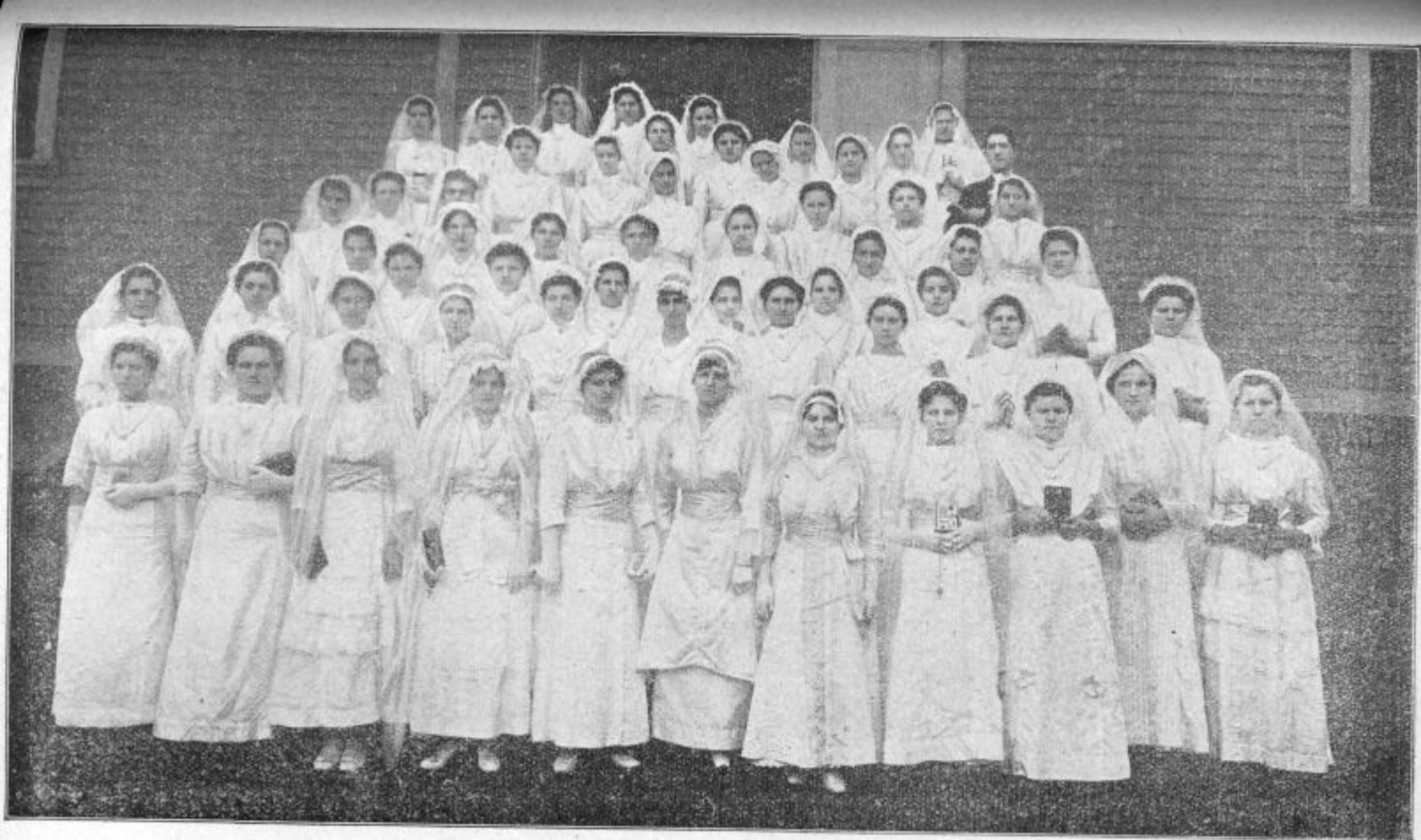
Marijina družba naših slovenskih deklin v Bridgeporti v Sev. Ameriki.