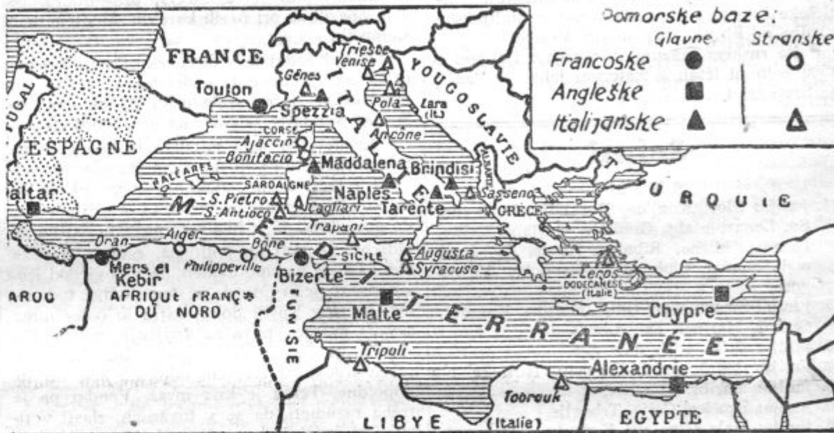
Po izstopu Francije iz sedanje vojne utegne postati Sredozemlje važno vojno pozorišče.