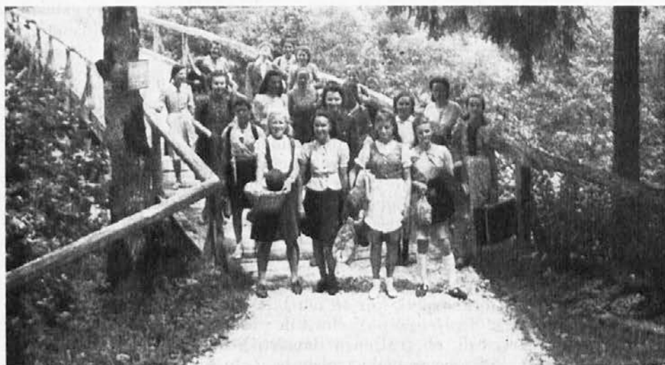
Soncu in Bogu naproti

Srečala sem otroka. Beden je bil in ubog. Lačen kruha in ljubezni. Neugnan je bil v svoji mladosti. Življenje je kipelo v njem — pomlad je