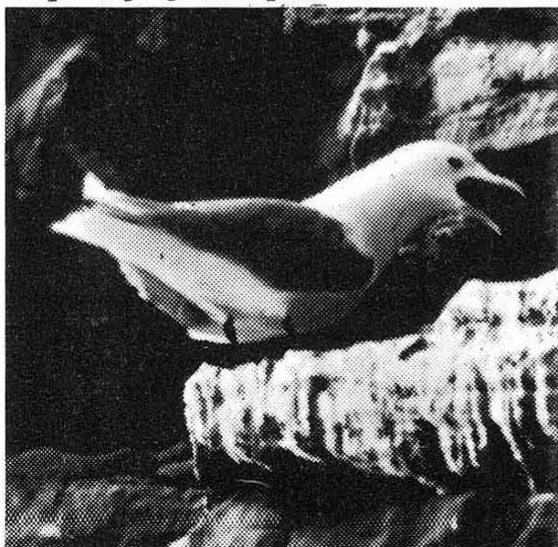
22. Triprsti galeb na gnezdju na otoku Helgoland, april 1974 (I. Geister) 22. Kittiwake at the nest found on the Helgoland Island, April 1974 (I. Geister)

Iz zgodovine ornitoloških opazovanj na Slovenskem je znano, da je Schiavuzzi opazoval triprstega galeba 24.2.1879. leta v Piranu. Triprstega galeba v svojih delih omenjata tudi Freyer (1842) in Schulz (1890). Prirodoslovni muzej Slovenije hrani v svoji zbirki meh samice iz žužemberka z datumom 4.5.1879. V Hrvaški nedaleč od meje s Slovenijo je Hirtz v kraju Žumberak opazoval triprstega galeba prav tako leta 1897.