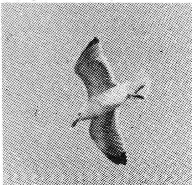
23. Triprsti galeb, odrasli primerek v letnem perju, april 1974 23. Kittiwake, a fullgrown specimen in breeding plumage, Helgoland Island, April 1974