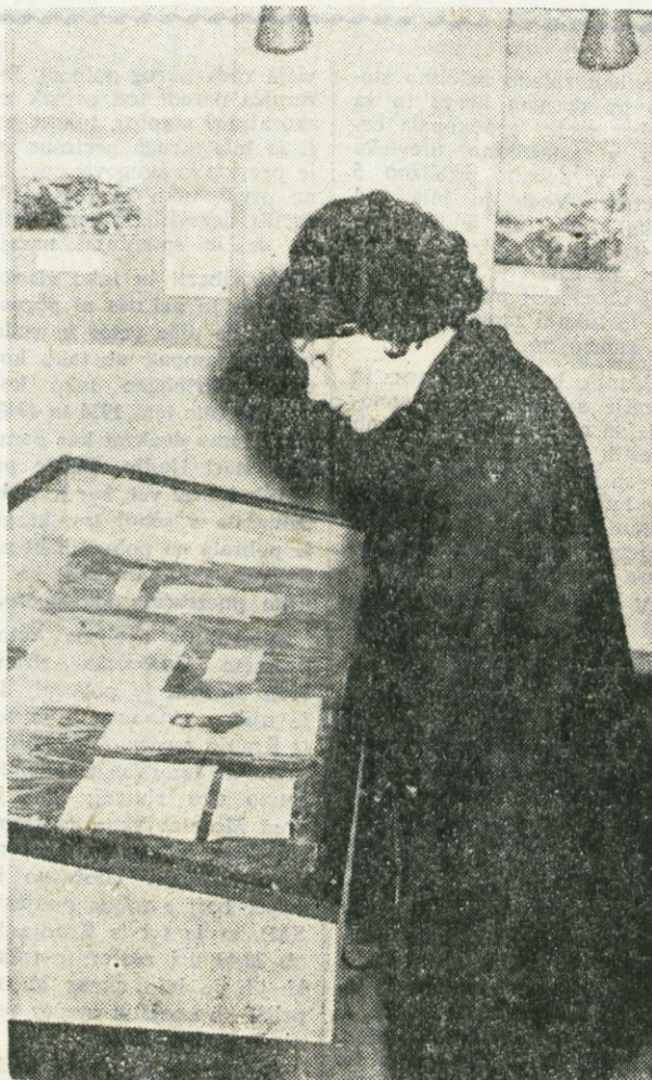
Z razstave »Prešeren in Cop« v galeriji Prešernove hiše; več o tem berite na 8. strani

za pomoč v računovodstvu z znanjem strojepisja za dobo 6 mesecev. Interesenti naj se zglase osebno ali pismeno na upravi podjetja. Nastop službe takoj ali po dogovoru.