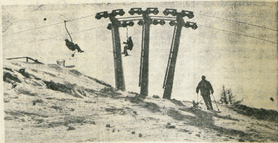
Zimski motív s Španovega vrha

Predavanje bo prilagojeno prometnim in drugim prilikam v samem kraju. Na območju bivše občine Cerklje je precej zelo slabih cest in sorazmerno veliko prometnih