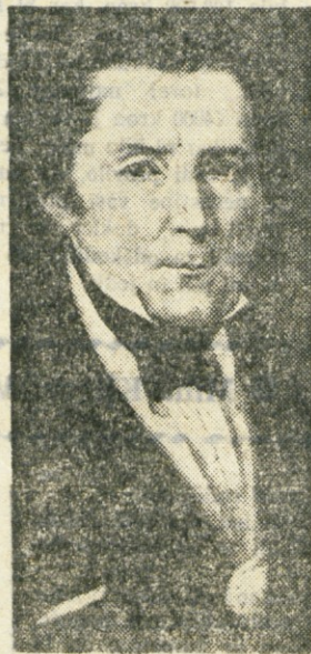
Matija Čop, slikal M. Langus 1828 (olje)