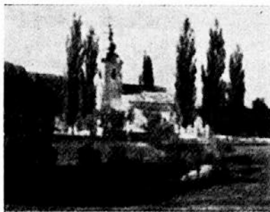
Farna cerkev v Vinici