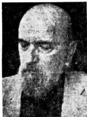
MOJSTER MEŠTROVIČ UMRL

Zadet od srčne kapi je padel svetovno znani kipar Ivan Meštrovič, eden najbolj znanih Hrvatov. Živel, delal in učil je v severni Ameriki in tam tudi umrl. V državi Indiana, v mestu South Bend, je velika katoliška univerza Notre Dame, kjer je rajni poučeval.