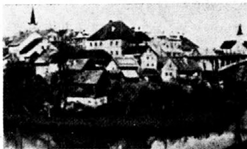
Črnomelj — če je še tak

mislih, sem pač tudi jaz sin Bele krajine, ki ste jo ljubili in se zanjo žrtvovali. Po njej Vam je v tu-jini krvavelo srce. Najboljši dokaz te ljubezni in Vaše navezanosti na moj rojstni kraj je Vaša poslednja pesnitev: Slovo od Bele krajine.