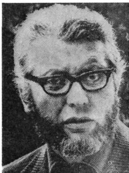
Taras Kermauner LASTNE PODOBE (eseji)