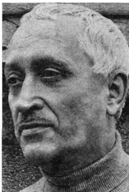
Igor Torkar DESETI BRATJE (roman)