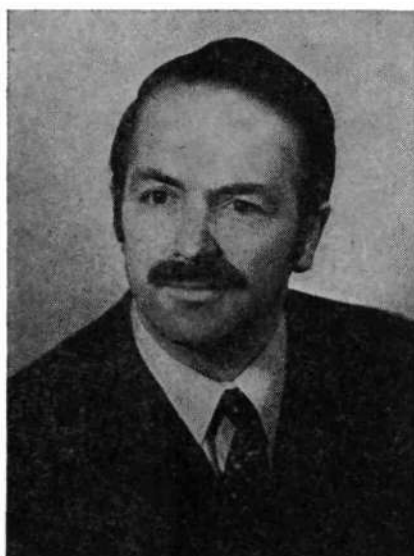
Leopold Suhodolčan TRENUTKI IN LETA (roman)