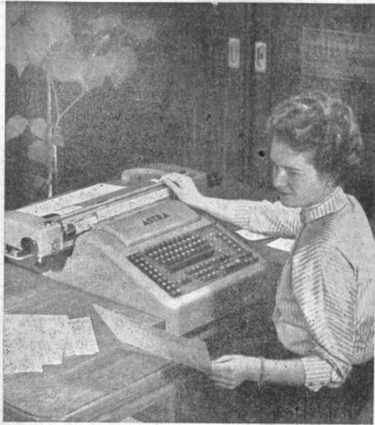
Pri delu s knjigovodskim strojem znamke »Astra«.

Medtem, ko sem si stroje ogledoval, sem vprašal za mnenje o njih tudi uslužbenke, ki s stroji delajo. Dejale so, da je sprva, ko še strojev niso poznale, šlo težavno. Danes bi za nobeno ceno več ne zamenjale s klasičnim vodenjem knjigovodstva. Odpadlo je delo pozno v noč, nihče ne prenaša računskih strojkov po pisarnah, nihče se zanje tudi ne »pretepa« in kar je najpomembnejše — vsaka stvar je v redu