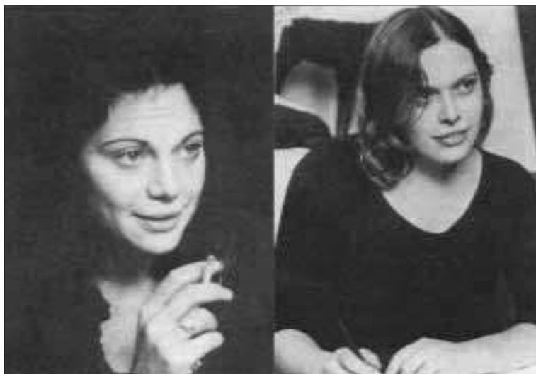
Članice Jezne brigade?