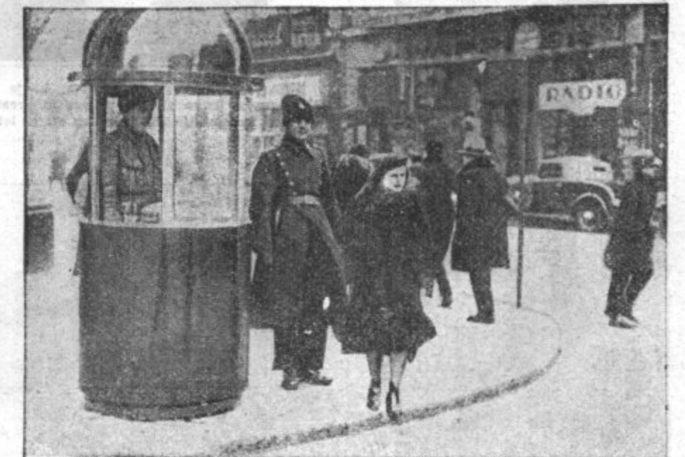
STRAZNIKI V UTICAH. V Rumuniji je pritisnil takšen mraz, da so postavili na križiščih za prometne stražnike posebne kioske, ki jih vsaj nekoliko varujejo prezebanja.