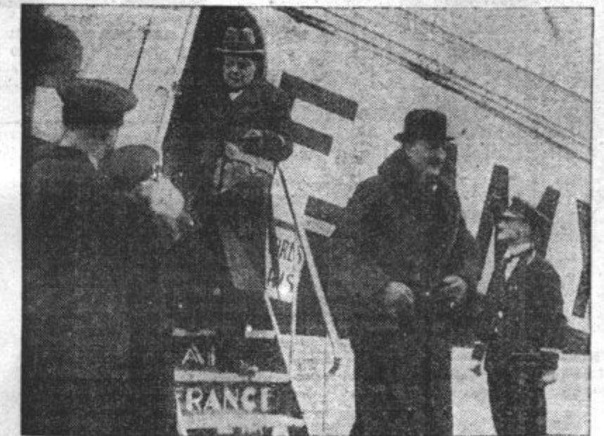
Po uspehli pogajanjih s angleško vlado se je vrnil francoski ministrski predsednik Flandin s letalom v Pariz.