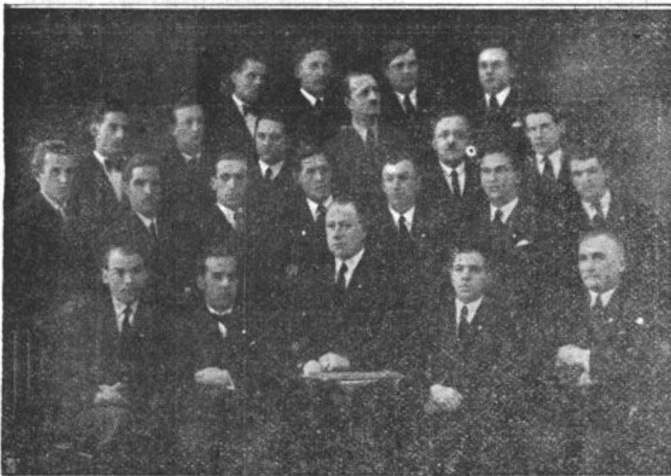
LEP PEVSKI PRAZNIK. Pri nas so pevski prazniki pogosti, saj je pevska kultura na višku ter imamo nešteto društev, ki goje lepo pesem in blaže z njo duha in srca. Vendar ne sme ostati neopažen pevski praznik mlade pevске družine, ki obhaja te dni 10 letnico in priredi samostojni koncert 16. t. m. v Delavski zbornici, pevskega društva Save. »Sava« ni nikdar silila v ospredje ter se ni potegovala za slavo; ni je vodila ambicija, ampak le idealizem, ljubezen do pesmi. Pri nji ne sodelujejo pevci, ki bi hrepneli po nastopih v velikih koncertnih dvoranah pred množico občudovalcev, kajti družji jih le ljubezen do petja. V splošnem so preprosti ljudje, ki jim življenje ni praznik; najprej morajo misliti na kruh, ki se ne morejo povsem posvečati petju.