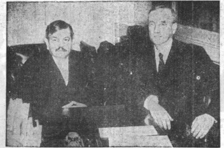
Na londonskem sestanku francoskih in angleških državnikov se razgovarjata francoski sunanji minister Laval in angleški predsednik razorožitvene konferenc Artur Henderson.