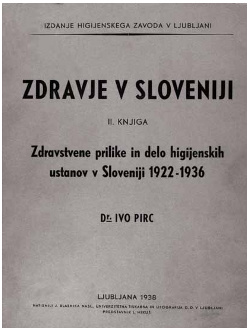
Slika 5: Naslovnica temeljne knjige dr. Iva Pirca Zdravje v Sloveniji 2. Zdravstvene prilike in delo higijenskih ustanov v Sloveniji 1922–1936 .

V drugi polovici dvajsetih let se je začela v Kraljevini SHS politična situacija spreminjati, financiranje je upadalo, dokler se ni z uvedbo Aleksandrove diktature družbeno-politični pogled vodilnih distanciral od smernic socialne medicine. Zdravstvo se je decentraliziralo in preneslo sedež z ministrstva za zdravje v Beogradu na sedeže banovin. Od novembra 1929 je tako za Slovenijo Dravska banovina večinoma odredjala sredstva za zdravstvo. Ti ukrepi so vplivali na razvoj javnega zdravstva v vsej Kraljevini Jugoslaviji: hitra rast mreže javnega zdravstva je bila po letu 1930 drastično pretrgana, nadaljnji razvoj je potekal stihijsko, le z veliko osebno zavzetostjo, lobiranjem ter prizadevanji za ohranitev doseženega stanja. Javno zdravstvo je postalo politično pomembno, zato je bil zlasti vodilni kader v njem pogosto na udaru. S preventivnimi programi so namreč pregloboko posegali v državno bla-