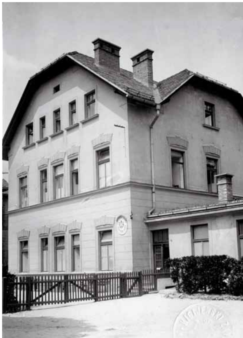
Slika 2: Stavba tamkajšnjega Higienkega zavoda v Ljubljani iz leta 1923.