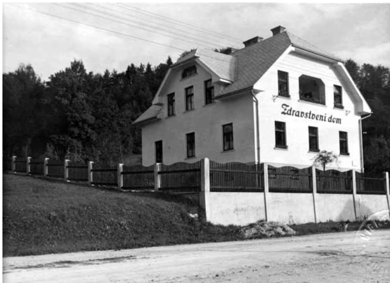
Slika 4: Prvi slovenski zdravstveni dom v Lukovici leta 1926.

tudi »Društvo treznosti« in »Društvo za varovanje narodnega zdravja«. 5 Celih 15 let je bil tudi urednik in izdajatelj revije Zdravje.