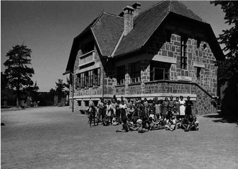
Slika 6: Prvi novozgrajeni počitniški dom za otroke na Rakitni v tridesetih letih 20. stoletja.

šolski dispanzer je bil v Ljubljani odprt v šolskem letu 1924/25. Veliko šolarjev je bolehalo za jetiko, zato so bili poslani na pregled v protituberkulozni dispanzer. Ker so bile pogoste bolezni ušes in grla, so v šolskem dispanzerju kmalu zaposlili otorinolaringologa, v šolskem letu 1927/28 zobozdravnika in leta 1932 tudi okulista. V letu 1928/29 so odprli mlečno kuhinjo, ki so jo nato v šolskem letu 1931/32 vpeljali v vse ljubljanske ljudske šole, tako da so tudi socialno ogroženi otroci dobili vsaj en mlečni obrok dnevno. 12 Od leta 1929 (do 1946) je kot antropolog delal na Šolski polikliniki tudi dr. Božo Škerlj (1904–1961), ki je v tem času utemeljil slovensko antropologijo in uvedel metodologijo dela fizične antropologije.