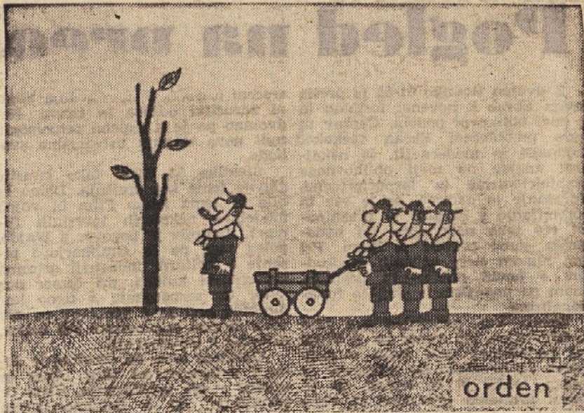
»ORDEN« — kratki film, realizacija Milan Ljukić, animacija Miroslav Kijovic

primerne (samo)izobrazbe in tudi ne trpi normativnega pristopa k delu z mladino. Težko se izognem misli: filmski seminarji v zimskih in letnih počitnicah so zares potrebni in koristni.