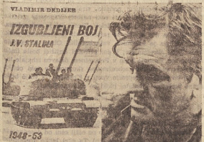
VSE TISTE, ki še niso kupili knjige