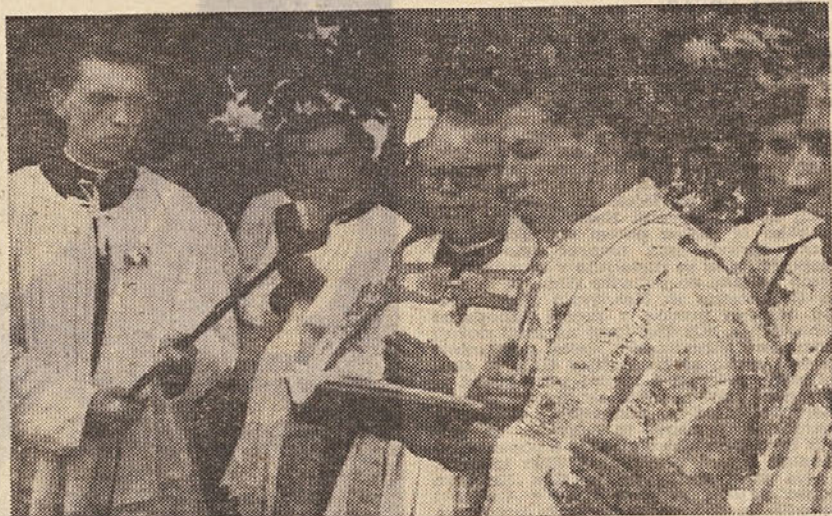
Iz kratkega filma Dušana Povha »Nova maša«

Čemu nisem govoril o vsebini filma, ki bi bila uporabna za filmsko vzgojo? Omenil sem že eno stvar: to je bolj odvisno od učencev kot od nas. Poleg tega pa so vsi filmi odsev družbe in njihov vrednot in zato lahko tudi nepomembni in povsem slabi filmi služijo usmerjanju. Tako imenovani umetniški filmi le predstavljajo to funkcijo veliko bolje, vendar je to stvar stopnje. Lahko imamo negativno (pa tudi pozitivno) stališče do intelektualne vsebine »umetniškega« filma, pa vendar zelo občudujemo njegove kvalitete. Odičen film lahko zelo malo usmerja, če je stališče učitelja napačno ali če mu je učenec nenaklonjen.