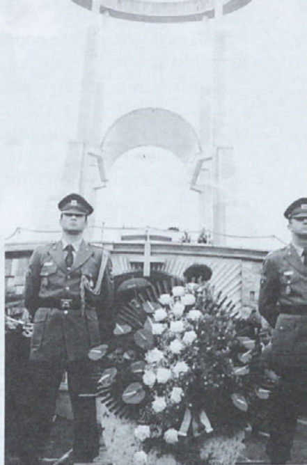
Častna straža Slovenske vojske v nedeljo pred spomenikom v Teherjah

Doma komunisti priznavajo ta zločin. Toda zanj ni ne obžalovanja,