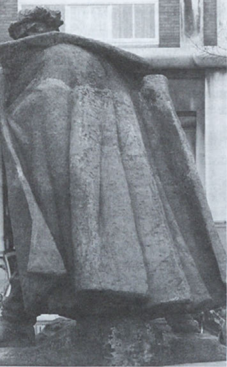
“Ilegalec” pred notranjim ministrstvom v Ljubljani. Kip je posvečen medvojnim vosovskim morilcem.

komuniste, ko jim je ukazal Stalin, »da se je treba bojevati ne glede na žrtve,« vendar se je ta nuja sprevrgla v razredno vojno. Pobijali so nasprotnike komunizma doma.