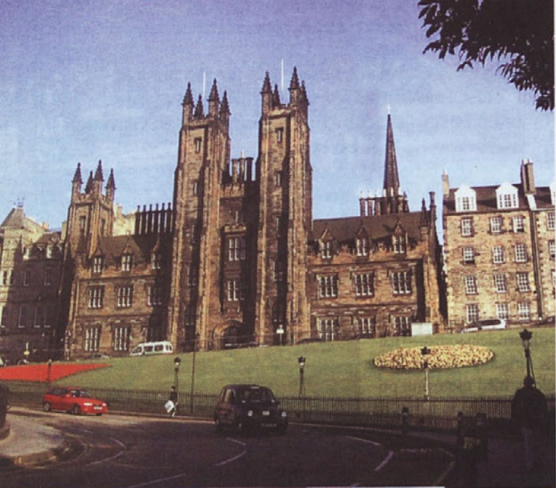
Edinburski grad, ponos mesta