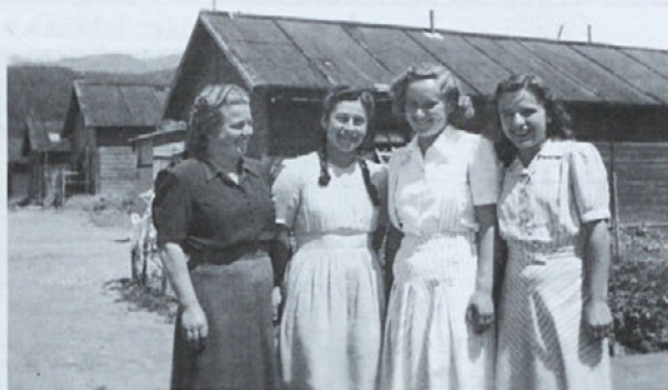
Taborišče Spittal - Dekleta pred odhodom v daljni, tuji svet

Prisrčna hvala vsem darovalcem. Bog vam povrni v sreči, uspehu in zdravju!