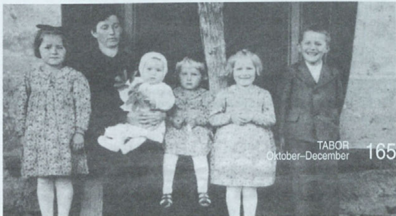
Bradeškova mati z otroki pred pobojem 1. avgusta 1942

Živeli smo na majhnem posestvu in starša sta morala pogosto razmišljati, kaj nam bosta dala jesti. Morda je bila po takratnih merilih