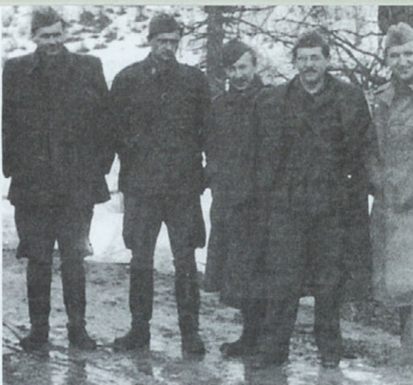
Edvard Kocbek je leta 1942 za svoje revolucionarne somišljenike in s tem tudi zase zapisal, da "ima pravico biti neusmiljen, sme vzeti življenje posamezniku in odkloniti ozire na osebne kvalitete in namene" . Kocbek (tretji z leve) med svojo tovarišijo; četrti je Edvard Kardelj.

Po Dolomitski izjavi sem v odnosu partije do OF zaznal izostren