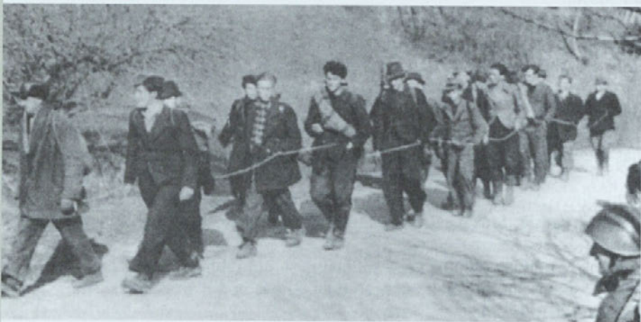
Ujeti partizani I. bataljona Dolomitskega odreda konec marca 1943.

Ob vsaki sovražni ofenzivi so bili vojaški in politični vodje partizanov prvi v bunkerjih. To je bilo vedno najpomembneje – da se je vodstvo skrilo v varno zavetje bunkerjev, usoda vojaških enot pa je bila drugotnega pomena. Ko so Nemci s Sv. Katarine in s Toškega čela med ofenzivo spomladi 1943 zaprli mejo, Italijani pa so z južne strani zasedli dolomitsko območje in obkolili partizane, ki so varovali svoje najvišje partijsko politično vodstvo, je centralni komite zaradi svoje varnosti žrtvoval cel bataljon. Veliko partizanov je padlo samo zato, da se je partijsko vodstvo lahko pravočasno umaknilo in se poskrilo po bunkerjih. Bataljon Dolomitskega odreda bi se napadalcem sicer lahko še izmaknil, toda zaradi partijskega vodstva, skritega v neposredni bližini, je moral ostati na svojem mestu. Centralni komite je ves bataljon prepustil napadalcem. Med partizani, ki so varovali partijsko vodstvo in so bili prepuščeni bridki usodi, je bilo veliko ujetih, ranjenih in pobitih. Partija ni želela ničesar prepustiti naključju. Več desetina partizanov so žrtvovali z izgovorom, da je obstajala nevarnost, da bi sovražnik lahko našel bunkerje.