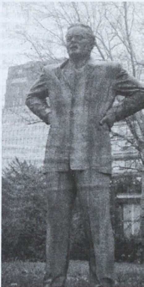
Spomenik Borisu Kidriču v Ljubljani

To organizacijo NOB je po 2. svetovni vojni ustanovila komunistična partija, ki jo je tudi ves čas vodila in usmerjala. To ni bila nikoli organizacija vojnih veteranov, kakršne so v zahodnem svetu, temveč izrazito poli-