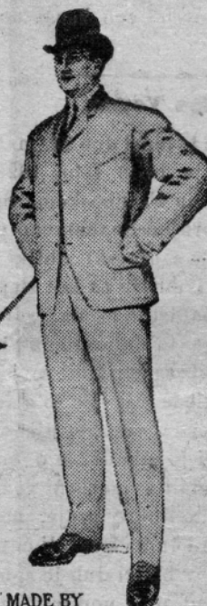
MADE BY LOEWENSTEIN & SONS CHICAGO

Naše fine moške praznične srajce po 50c, 75c, $1, $1.50, $2 in $2.50.