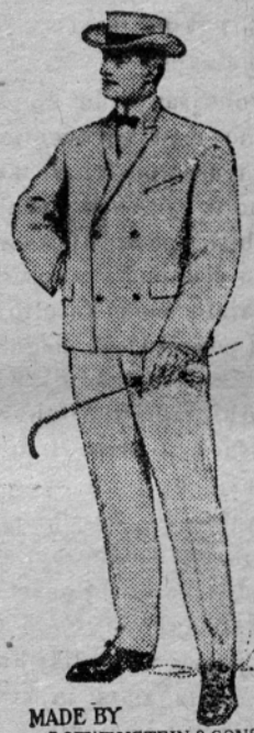
MADE BY LOEWENSTEIN & SONS CHICAGO