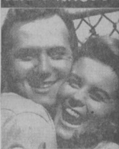
21. in 22. maja bo na sporedu v kinu »Svoboda« film SEJEM V TEKSASU. Vrtil pa ga bodo tudi 21. maja v filmskem gledališču. — Vabimo vas na ogled!