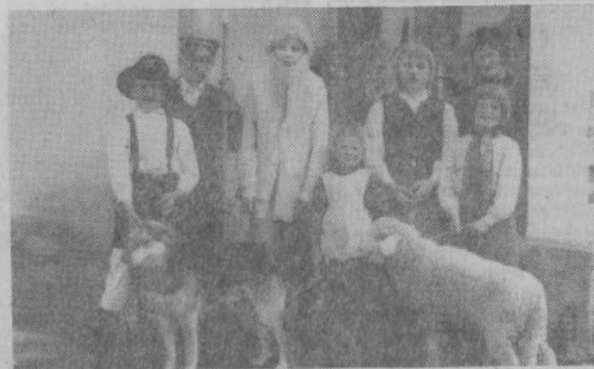
Mladinska sekcija prosvetnega društva v Zavodnjah je dvakrat uprizorila igrice »Kekec«. Predstavo so si ogledali tudi učenci iz Soštanja. Na sliki: mladi igralci iz Zavodnje in I. osnovne šole v Soštanju.