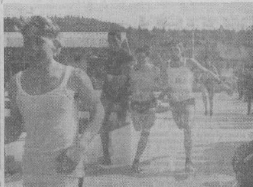
Borba za najboljšo uvrstitev na krosu RŠC