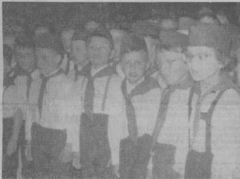
Zapeli so pionirji...

Kljub čedalje večjim žrtvam prebivalcev tega okoliša, nemškemu okupatorju ni bilo mogoče zatreti osvobodilnega boja. 1943. leta so se