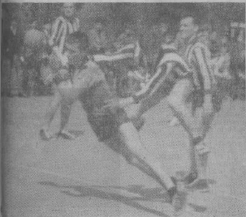
Prizor s tekme Velenje : Šoštanj. Kac pred golom Velenjčanov.