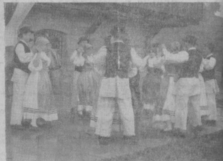
Belokranjske in gorenjske plesne so zaplesali folkloristi iz Ljubljane

izvedli gluhi na Pirševem domu, so Ljubljancem nadvse uspešno zaplesali gorenjske in belokranjske plesne. Z recitacijami pa so sodelovali udeleženci iz ostalih krajev. Škoda, da je prireditelj oviral dež, ker nam gluhi ob slabem vremenu niso mogli prikazati vsega kar znajo.