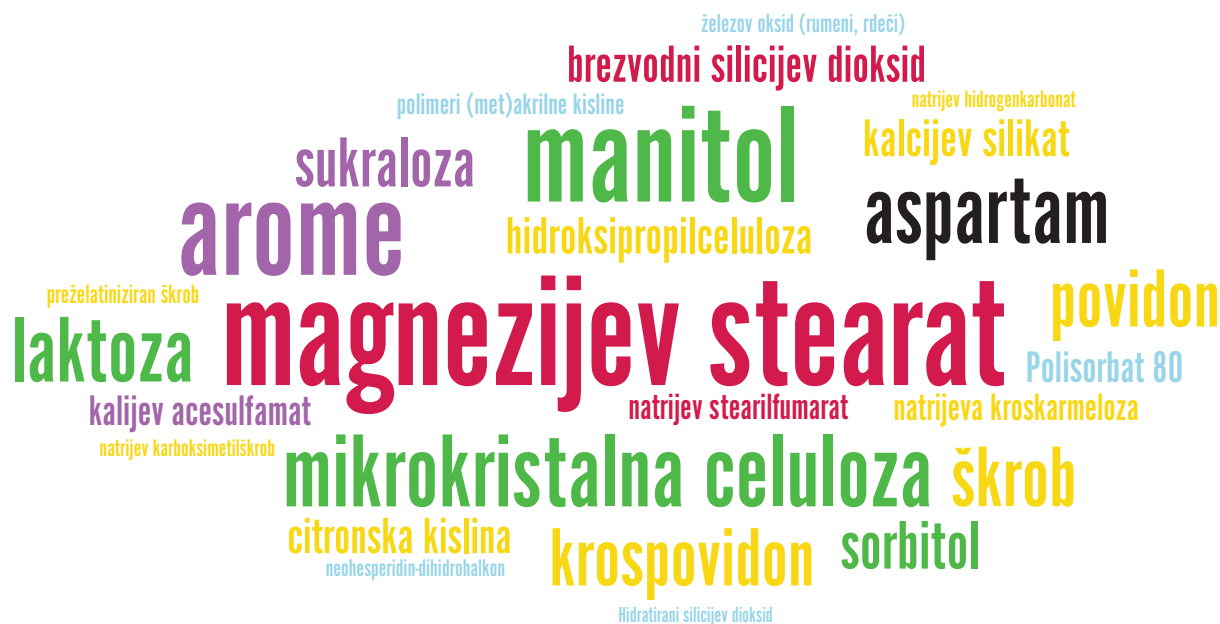
Slika 2: Najpogostejše pomožne snovi v orodisperzibilnih tabletah na slovenskem trgu; velikost besede na sliki je sorazmerna s frekvenco pojavnosti v izdelkih. Rdeča – drsilo, mazivo, antiadheziv; zelena – polnilo; rumena – razgrajevalo; rožnata – pomožna snov za izboljševanje okusa; modra – drugo. Slika je bila generirana na spletni strani https://www.wordclouds.com/ .