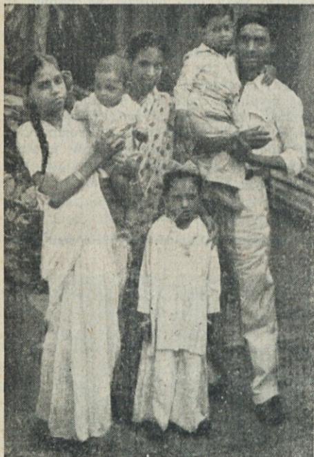
Bengalska katoliška družina.