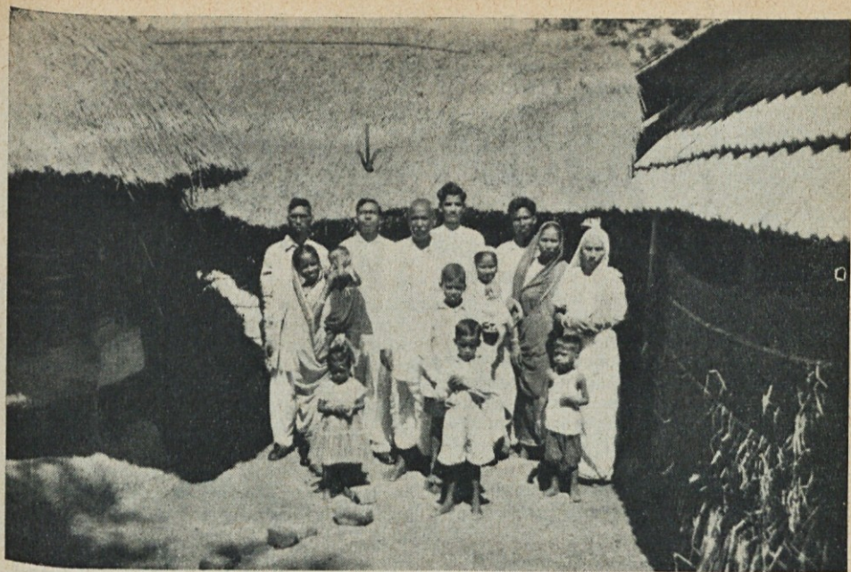
Iz o. Demšarjevega misijona v Khariju: Družina domačega bogoslovca Orupa.