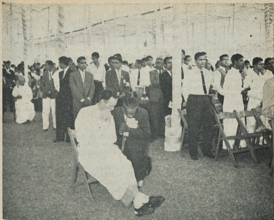
Indijci se spovedujejo na evharističnem kongresu v Bombayu.