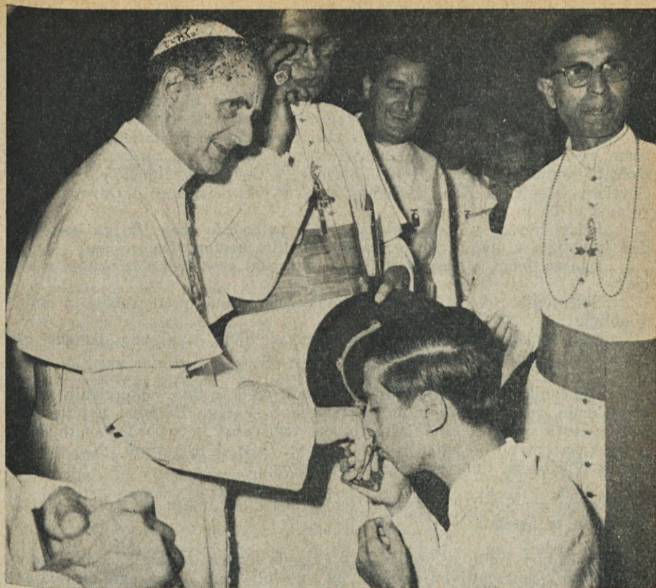
Indijski mladec poljublja pastirski prstan svetemu očetu na svetovnem evharističnem kongresu v Bombayu.

„zlate ostroge“ oziroma z „Vitez angelske zlate armade“, ki je najvišje odlikovanje Vatikana vladajočim knezom. Druga papeževa gesta je bila namenjena užaloščeni družini mladega poročevavca, ki je izgubil življenje, ko je ves zaverovan v posel slikal s svojega kamijona sv. očeta. Poklonil je vdovi 5.000 rupij za vzgojo hčerke edinke.