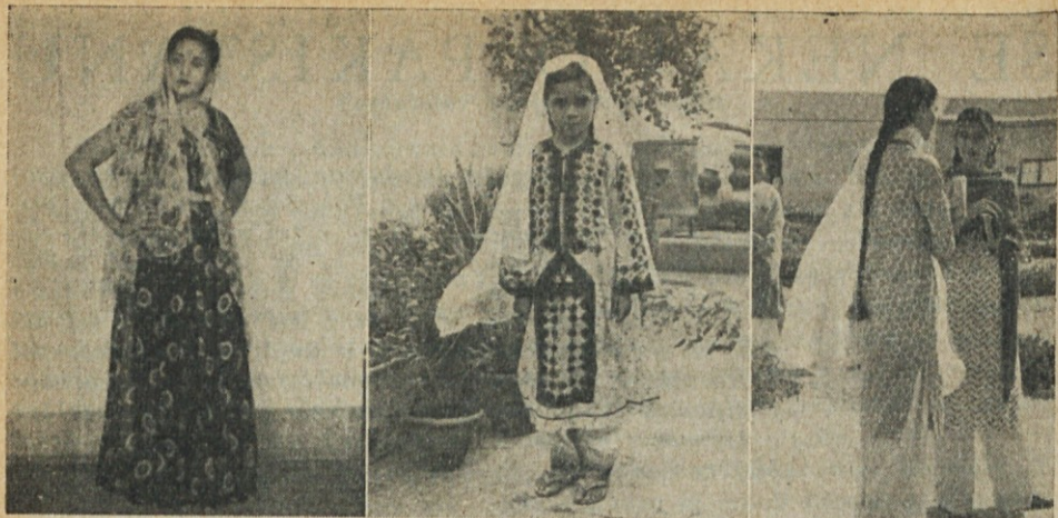
Kako se Pakistanci nosijo — Od leve na desno: Narodna noša. Sindska noša. Akademičarki.