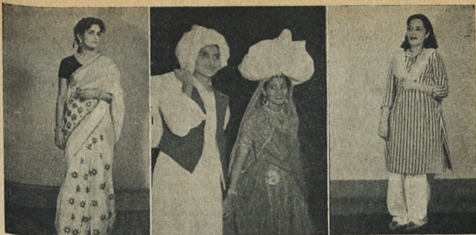
Se drugi primeri oblačenja v Pakistanu: Sari. Kmet in kmetica. Shalwar-kamiz.