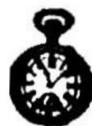
Žepna ura srebrna L. 50.—