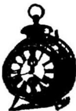
Ure budilke Lir 18 največja; jamčnina 2 leti.

P. n. lastnika se priporočata slavnemu občinstvu na deželi in v mestu.