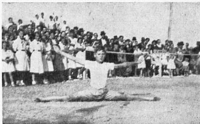
14 letni Grmek iz Kranja mnogo obeta.

Naša tradicionalna pomladanska akademija v Unionu je letos privabila posebno mnogo ljudstva, da je bila največja ljubljanska dvorana do zadnjega kotička polna, počastilo jo je pa s svojim obiskom tudi toliko odličnikov, kakor jih še nismo videli. Oboje to dokazuje, kako se je priljubila naša elitna akademija vsem in vsakomur, kdor jo je že kdaj prej videl. Tudi letos je bil vsak udeleženec