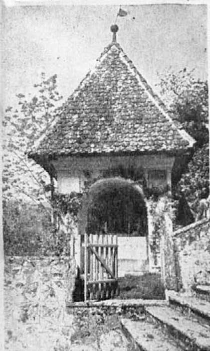
Na polju znamenje stoji.

Ljubezniv in discipliniran tovariš hočem biti vsem bratom v ZFO.