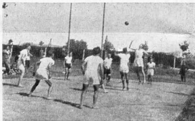
Mariborski tabor 1939. Odbojka. Kranj : Dev. Mar. v Polju.