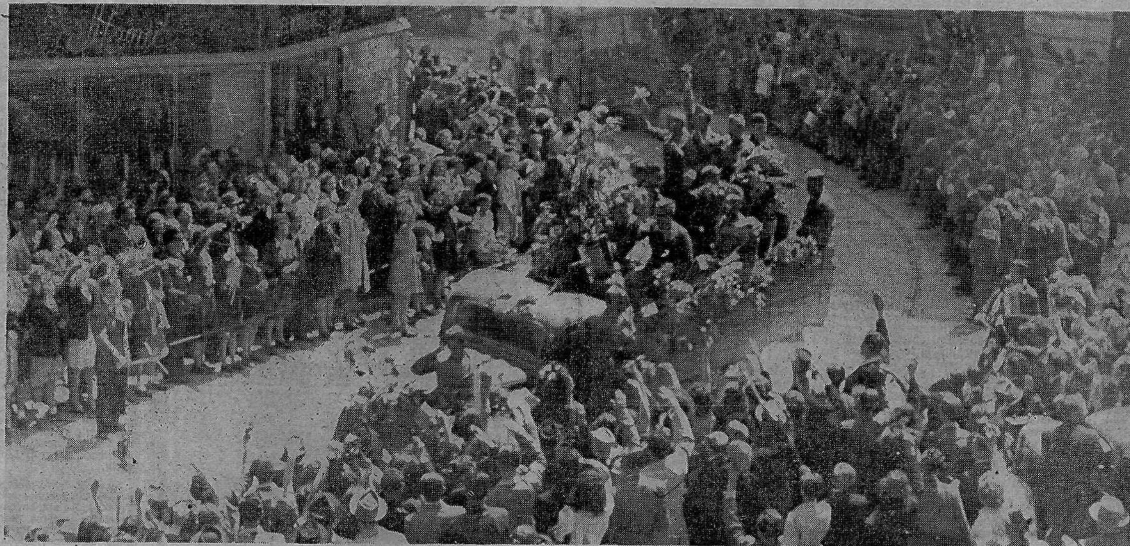
Partizanske brigade, osvoboditeljce naše domovine, se 9. maja z vseh strani zgrinjajo v Ljubljano

Opusti, da ti pišem že drugič zapored. Tvoje zadnje pismo je žal še v predalu. Upam, da bo tudi nam prišla vrsta. Čast so takšni, da moramo marsikaj opraviti mimo vrstnega reda. Prepričan sem, da to razumeš. Zato ti sporočam naslednje: