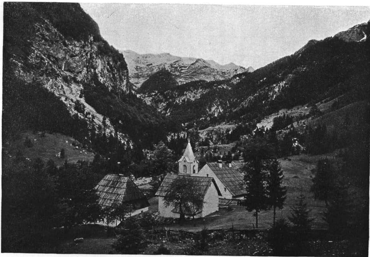
Sv. Marija v Trenti.