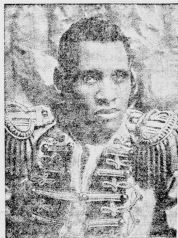
Najboljši igralec med črnici