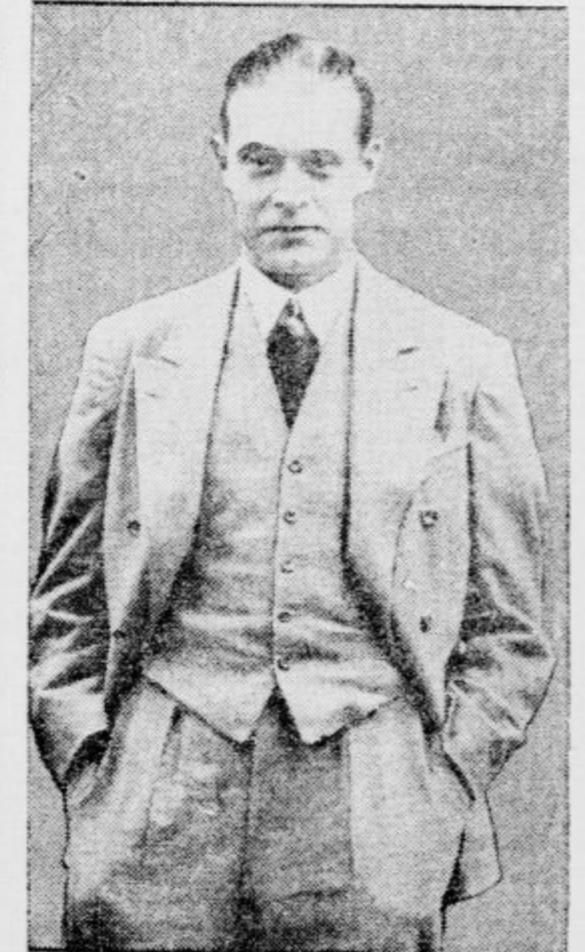
Kandidat za monaški prestol