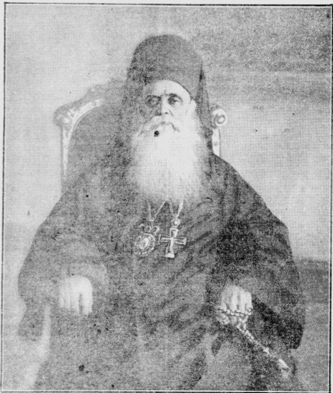
Beograd, 7. aprila.