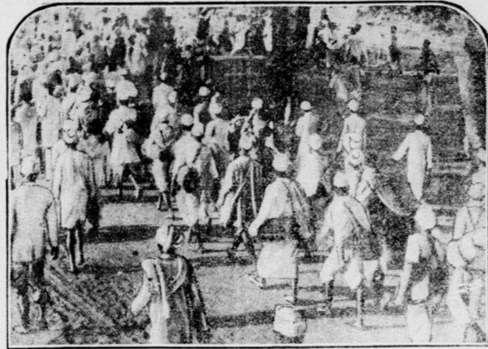
Gandhijev »bojni« pohod do morja

Desno: Cesarica Judita, ki je nedavno umrla. Levo: Dosedanji regent Ras Tafari, ki je postal »cesar vseh cesarjev«, kakor Abesinci imenujejo svojega vladarja.