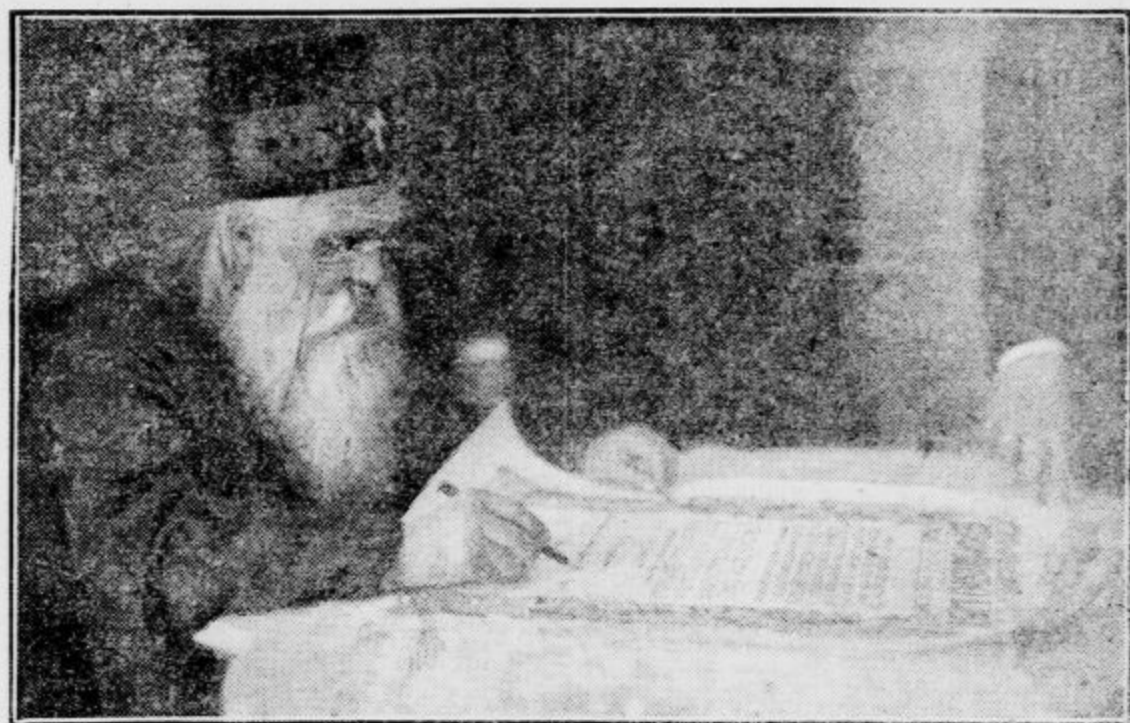
Patrijarh Dimitrije podpisuje spominsko listino na svoj prvi poset v Ljubljani

Po službi božji je patrijarh v svojem apartmanu v hotelu »Slon« sprejemal številne deputacije, nakar se je vršila svečana seja pravoslavne občine pod njegovim predsedovanjem. Popoldne je patrijarh obiskal stolno cerkev sv. Nikolaja ter civilnim, vojaškim in duhovnim predstavnikom vrnil poset. Naslednji dan je bil visoki gost namenjen na Bled, toda tragična vest o smrti njegove sestre je povzročila njegov nenadni povratek v Beograd. Njegova želja, da bi se enkrat videl Slovenijo in posetil njen gorenjski biser, se mu ni več izpolnila, a takisto se ni obneslo pričakanje slovenske javnosti, da bo visokega cerkvenega poglavarja še enkrat s simpatijo in spoštovanjem sprejela v svojo sredo.