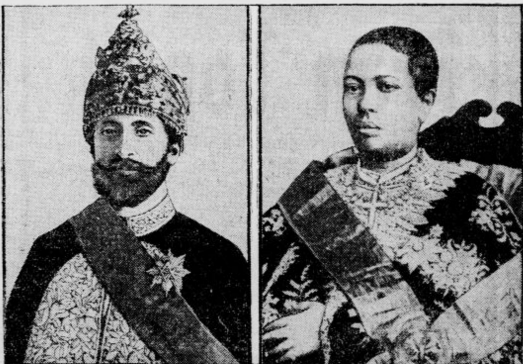
Sprememba na abesinskem prestolu