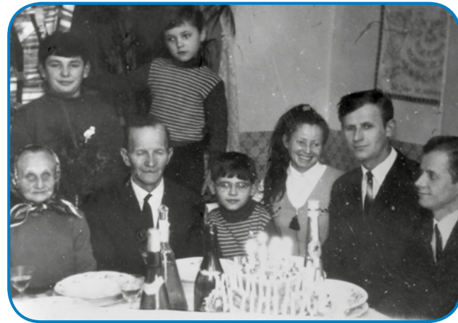
Ta kejpi je bijo napravleni, gda je mati mejla 70. rojstni den

»Dobro, zato ka te smo vsi srmaki bili, vsi smo gnaki bili, fejest dobro je bilau tam gorrasti. Zato je pa meni fejest špajšno bilau sé v Varaš priditi.