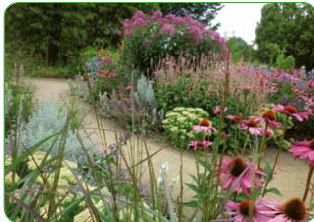
Skupina različnih trajnic

Vrtne trajnice dobivajo vedno večjo veljavo pri ljubiteljih in zbirateljih rastlin. Bolj množično se pojavljajo v zasebnih vrtovih kot v javnih nasadih. Spremenila se je le izbira. Niso vse vrste in sorte za vsak vrt.