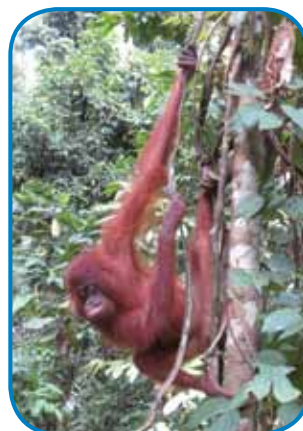
Orangutan v zavetišči na otoki Borneo