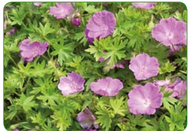
Krvomočnica primerna kot pokrovnna rastlina

in parkih v vsem svojem razmahu šele v novejši dobi, danes ni vrta in tudi ne mesta v njem, kjer jih ne bi sadili in gojili. Sadimo jih tudi tam, kjer varujejo zemljo pred erozijo. Trajnice razmnožujemo (generativno) s semenom, z deli rastlin (vegetativno), največkrat pa z delitvijo. Najboljši čas za delitev trajnic je