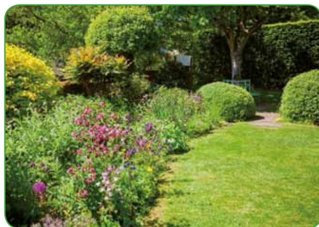
Trajnice potrebujejo ogrodje, to so drevesa in grmičevje

Najpomembnejša skupna lastnost trajnic je, da rastejo in živijo po več let, pogosto tudi desetletja. Nekatere med njimi potrebujejo po več let, da se prav vrastejo na svo-