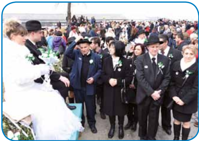
Ena od glavnih organizatork borovega gostuovanja v Sakalovcih je bila leta 2019 Državna slovenska samouprava - porabska šega je vpisana v Register nesnovne kulturne dediščine na Madžarskem

kem - deloma - rešilo šele leta 2014. »Tudi to je bilo ena od glavnih tem na zasedanjih dvostranskih manjšinskih mešanih komisij. Zato predstavlja velik korak, da smo Slovenci dobili - zelo aktivno - zagovornico v madžarskem Parlamentu. Tam se srečuje z ministri in poslanci, lahko torej doseže veliko. Z zagovornico imamo vsakodnevne stike, moramo namreč nasto-