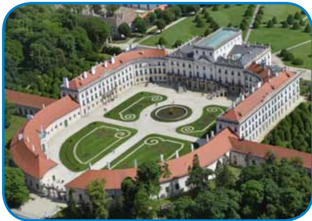
Dvorec držine Esterházy so lepau gorobnauwili - dosta domanji pa tihinski turistov ga gorpoiške

Zavolo kolonizacije pa méрни cajtov je numera lústva v Vogrskom kraljestvi do konca 18. stoletja več kak duplanska gratala: gda so narod med letoma 1784 ino 1787 vküpsteli, je v rosagi kauli 8,5 miljauna lüdi živelo. V prišešnji desetletjtaj je ta numera dale rasla ino do srejde 19. stoletja dosegnila