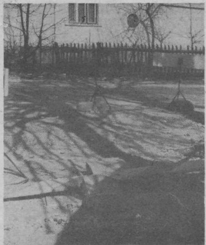
Komunalna skupnost občine Ljubljana Moste — Polje nam je poslala naslednji odgovor:

Po Tovarniški in Zvezni ulici je bila opravljena sanacija plinovodnega omrežja. Po Tovarniški ulici je bilo zamenjano celotno dotrajano omrežje, povečan pa je bil tudi profil plinovoda. To bo omogočalo dodatne možnosti za priključitev na plinovodno omrežje za ogrevanje. Po Zvezni ulici je bila opravljena sanacija obojnih spojev obstoječega plinovoda. IPK, TOZD Plinarna, ki je investitor in izvajalec teh del, je že naročila popravilo cestišča in bo to opravljeno, čim bodo to dopuščale vremenske razmere.