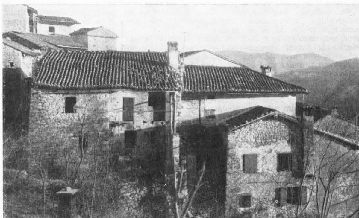
Takole izgledajo hiše naših ljudi, ki jih je ekonomska kriza pognala daleč v svet za vsakdanjim kruhom. Ta slika je bila posneta v vasi Breg, ne daleč od Flejpana, ki pa i pa spada sedaj h komunu Brdo v Terski dolini.

S tem, da je tako strahovito padlo število prebivalstva, pa nastaja novo vprašanje, če je sploh mogoč še nadaljnji obstoj samostojne občine. Vzdrževati občinski upravni aparat za 600 ljudi - in še ti niso vsi pri hiši - ni tako lahko in zato se že dlje časa