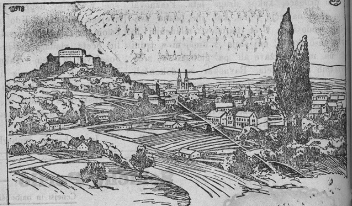
Ansicht von Görz.

Prinašamo sliko lepega mesta ob Soči, ki je postalo žrtev italijanskemu barbarstvu. Brez vojaške potrebe, pa tudi brez vsacega ozira na mednarodno pravo in kulturno nravnost so Italijani to lepo mesto s težkimi bombami in artiljerijskimi kroglicami porušili. Značilni čin za „popolo romano“, ki je hotel „odrešiti“ ubogo prebivalstvo onkraj savojskih mej. V Kostonjevici pri Gorici Italijani