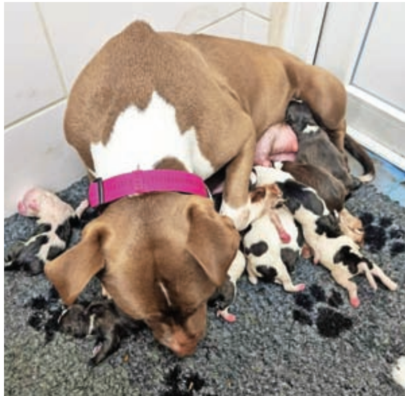
Odvzeta psica z območja medvoške občine je v Zavetišču za zapuščene živali Horjul skotila kar enajst mladičev.

Na vprašanje, kje iskati največje krivce za nastalo situacijo, Polona Samec odgovarja: »Največjo odgovornost pripisujem kupcem psov, ki prihajajo iz takšnih razmer. V 21. stoletju in pri vsem ozaveščanju bi pač moral prevladati zdrav razum