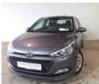
Hyundai I20 1.4 CRDI Life 90 KM, letnik 2017, 1. lastnik, avtomatska klima 10.740 EUR