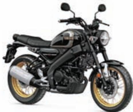
Izbira motociklov v razredu 125 ccm je velika; na sliki je motor Yamaha XSR 125 Legacy.

Edini pogoj je, da prej opravite še šesturni tečaj v šoli vožnje in pridobite kodo 125. Sprememba Zakona o voznikih je začela veljati prvega junija lani. Ideja o tem, da bi lahko z vozniškim dovoljenjem kategorije B vozili tudi mopede, skuterje in