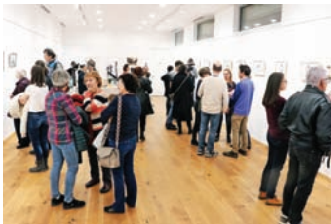
Obiskovalci so si z zanimanjem ogledali likovna dela mladih ustvarjalcev.

Magister profesor poučevanja likovne pedagogike poklicno deluje kot pedagog na gimnaziji in osnovni šoli. Ustvarja v tehniki akvarela, njegov motivni svet je vzeta iz šolskega vsak-