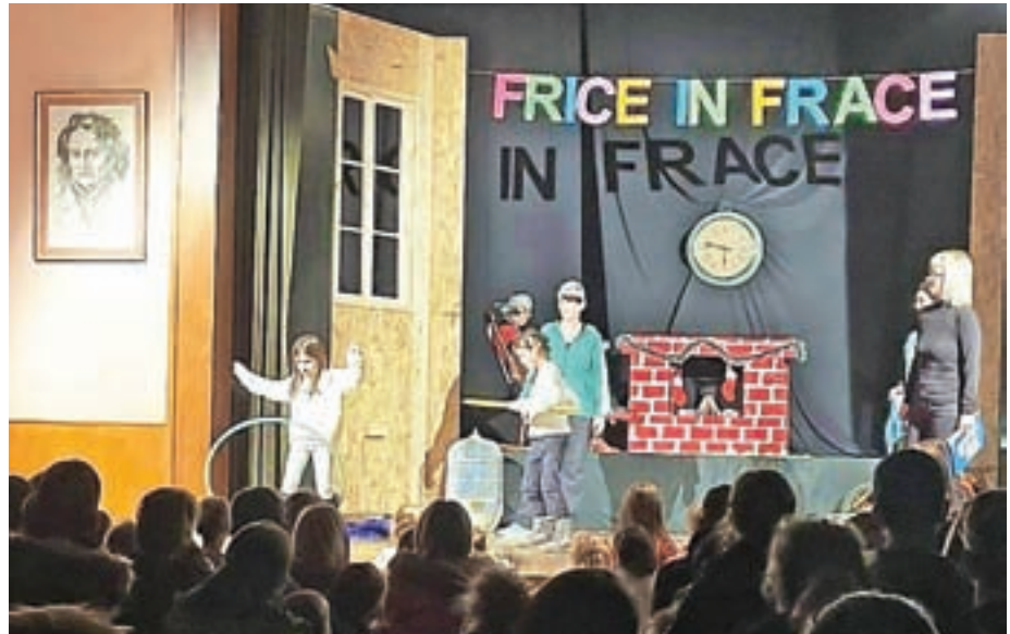
Predstavo so zaigrale na odru kulturnega doma v Sori.

Strokovne delavke Vrtca Medvode, enote Preska, so se decembrsko dogajanje odločile popestriti s predstavo Frice in Frace. »Namen je bil otrokom našega kraja ponuditi veselo doživetje in uživanje v umetnosti, kar je pomemben dejavnik uravnoveženega otrokovega razvoja. Gledališki dogodek smo izkoristili tudi za spoznavanje, druženje in sladkanje z jabolčnimi krhlji. Predstavo smo v prostorih KUD Oton Župančič Sora zaigrale dvakrat. Vsem obiskovalcem – starim staršem, staršem, malim in velikim otrokom – se želimo zahvaliti za pohvale, dober odziv in prostovoljne prispevke, ki so namenjeni v sklad vrtca. Sredstva sklada so namenjena pomoči socialno šibkim in nakupu nadstandardne opreme. Hkrati se zahvaljujemo tudi vsem posameznikom, ki so prispevali v sklad z individualnimi