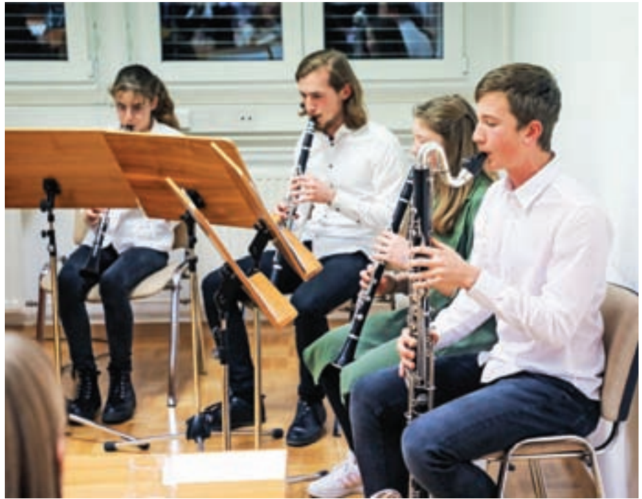
V kulturnem programu je nastopil kvartet klarinetov Glasbene šole Franca Šturma.