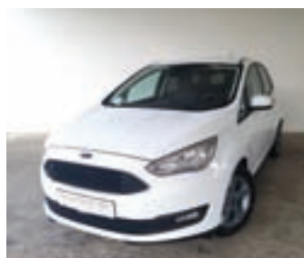
Ford C-Max 1.0 Eco 125 KM, letnik 2018, 1. lastnik, tempomat, avtomatska klima 14.499 EUR