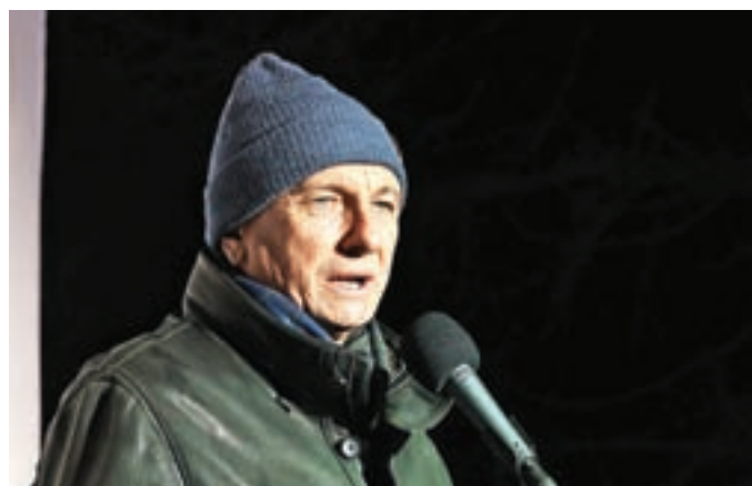
Slavnostni govornik je bil nekdanji predsednik republike Borut Pahor.