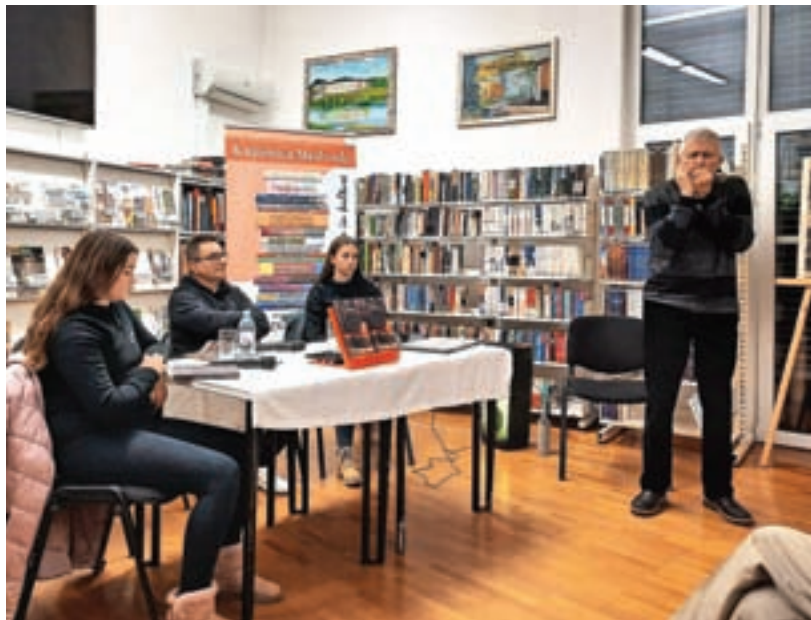
Utrinek s predstavitve romana v Knjižnici Medvode

In sedaj že piše nov roman. »Kraj dogajanja bo znova Piran, šel pa sem v povsem druge vode, v življenje duhovnika, ki je