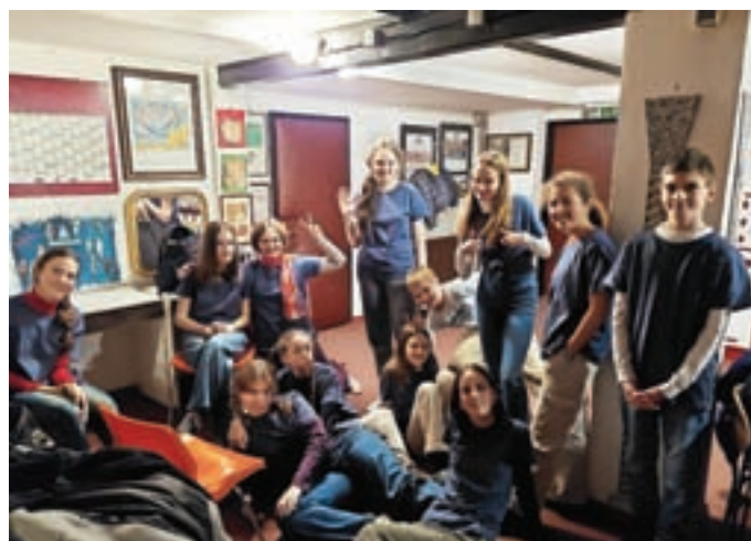
V sekciji sodeluje trinajst mladih.