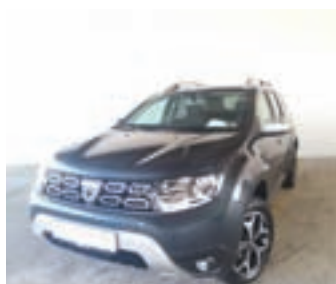
Dacia Duster 1.3 TCE 130 KM, letnik 2019, 1. lastnik, avtomatska klima, vzvratna kamera, navigacija 17.000 EUR