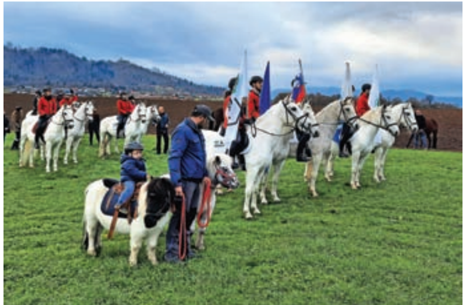
Čakajoči na blagoslov