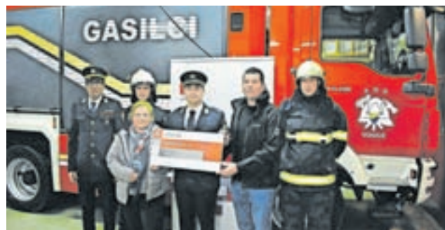
Zavarovalnica Triglav predala ček PGD Vodice

Novaloletna preventivna akcija Za boljši jutri pod okriljem Zavarovalnice Triglav poteka že deveto leto zapored. Ob koncu leta smo podprli 26 preventivnih projektov po vsej Sloveniji, v vseh devetih letih pa jih bo tako skupno že več kot 230 . Različnim organizacijam pomagamo pri nakupu defibrilatorjev, ultrazvočnih in EKG-aparatov ter drugih življenjsko pomembnih medicinskih pripomočkov. Podpiramo tudi gasilska društva in zveze po vsej državi ter številne druge projekte na področjih zdravstva, vzgoje in izobraževanja, civilne zaščite, poplavne in prometne varnosti. Območna enota Ljubljana je priskočila na pomoč prostovoljnimi gasilcem iz Vodice pri sofinanciranju novega vozila. Gasilci so tisti, ki so največkrat prvi na kraju nesreče, se prvi spopadejo s posledicami nesreč ali včasih tudi našega nepremišljenega ravnanja. Društvo bo tako še učinkoviteje posredovalo na intervencijah, saj skrbijo za varnost skoraj pet tisoč prebivalcev v občini Vodice.