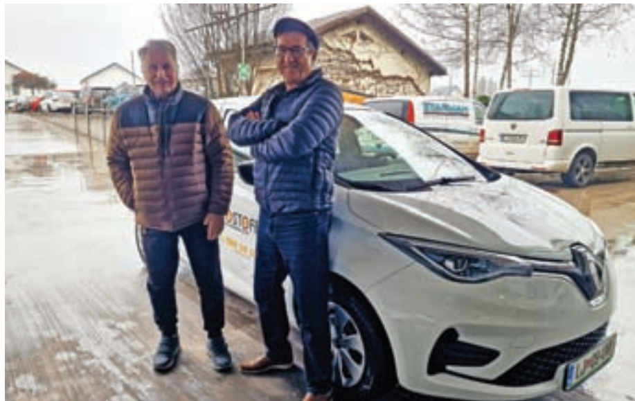
Vozniki prostovoljci so veseli, da lahko pomagajo uporabnikom brezplačnih prevozov, ti pa so hvaležni za to možnost.

Občinska volilna komisija Občine Medvode je razpisala naknadne volitve v svet Krajevne skupnosti Seničica - Golo Brdo. Kražani naselij Seničica in Golo Brdo lahko kandidature vložijo do 23. februarja 2023. Voli se pet članov sveta, volitve pa bodo 26. marca 2023. Pri izvedbi rednih lokalnih volitev v letu 2022 je namreč Občinska volilna komisija ugotovila, da kljub podaljšanemu roku za oddajo kandidatur za svet Krajevne skupnosti Seničica - Golo Brdo ni bila oddana nobena kandidatura. Skladno z navedenim volitve v svet te krajevne skupnosti v sklopu rednega glasovanja na lokalnih volitvah, ki so potekale 22. novembra 2022, niso bile izvedene. Na občini vse zainteresirane občane s stalnim prebivališčem na območju krajevne skupnosti Seničica - Golo Brdo, ki bi želeli delovati v krajevni skupnosti, pozivajo, da njihovi predstavniki pravočasno oddajo kandidature. M. B.