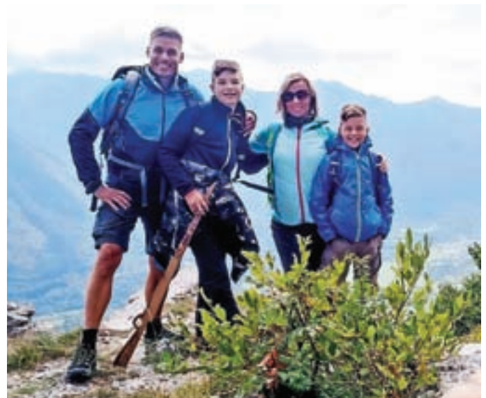
Družina Henigman živi športno življenje.