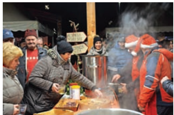
Najboljše kuhano vino je pripravila ekipa KS Seničica - Golo Brdo.