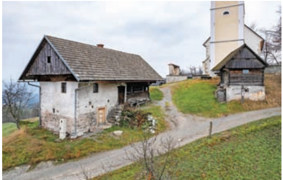
Na območju Polhograjci2 je bil izbran en projekt v vrednosti 25 tisoč evrov, in sicer Mežnarija, naša hiša in naša mladost v vasi Žlebe. Lotili se bodo obnove mežnarije s kaščo.

Izglasovani so bili naslednji projekti: Avtomatski zunanji defibrilator na Domu krajanov v Hrašah, Defibrilator v Dragočajni, Piramidno plezalo iz mreže ob osnovni šoli, Le pridi v Hraše in malo postoj!, Merjenje hitrosti v Valburgi (vsi KS Smladnik), Asfaltiranje ceste Topol 23a, Rekonstrukcija poškodovane asfaltne prevleke, Ureditev celostne podobe Polhograjskih dolomitov (Polhograjci), Ureditev okolice okrog šolskega vrtilčka, Dopolnitev igral na otroškem igrišču pri Športni dvorani Medvode, Dom starejših Medvode - nadstrešek avtobusnega postajališča, Svet je lepši z drevesi (KS Medvode - center), Postavitev boljših