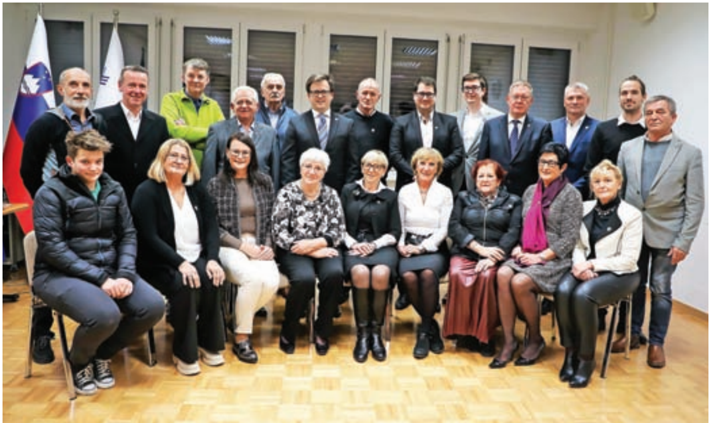
Župan in svetniki, prisotni na konstitutivni seji občinskega sveta mandata 2022–2026

Občine Medvode. Pri izvrševanju svoje funkcije bom ravnal vestno in odgovorno, v korist in blaginjo občank in občanov.« Sledil je še njegov nagovor. »Tretjič stojim tu pred vami in izrekam besede zaprisege, da bom v času opravljanja funkcije župana, najlepše službe in poslanstva, kar jih poznam, delal za napredek in prijetno življenje tu pri nas med vodami. Če kdaj, se prav sedaj, v teh časih, sprašujem, kaj je smisel skupnosti, kot je denimo občina. Če želimo govoriti o občini in ob tem ne nujno misliti le na kilometre asfalta in kubične metre betona, potem nam mora biti vedno pred očmi skupno. Upal bi si trditi, da je spoznanje, kaj in katere stvari so nam skupne, nujno in neizbežno povezano s komuniciranjem. Verjetno bo, poleg drugega, ena ključnih stvari pri gradnji skupnosti prihodnosti, če si prave skupnosti seveda sploh še želimo, prav vprašanje zaznavanja drugega, vprašanje iskrenega pogovora z njim, razumevanja in empatije, skratka komuniciranja