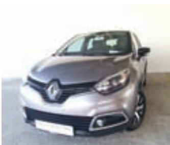
Renault Captur 1.5 DCi 90 KM, letnik 2016, 103.000 km, 1. lastnik, klima 11.450 EUR