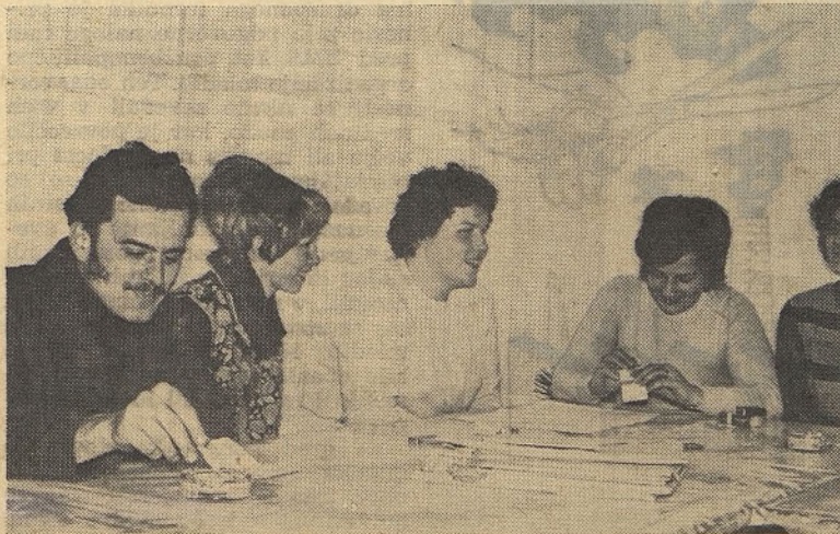
Mladinke in mladinci TOZD III na svojem sestanku

1. sredstva za Kozjansko je potrebno takoj nakazati na poseben žiro račun;