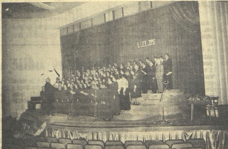
Mešani pevski zbor »Slavček« iz Trbovelj na jubilejni V. prireditvi Zasavske pevske revije v Trbovljah