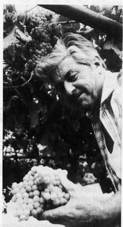
Iz cveta si me izpremenil v plod. Zoreč zdaj pijem sonca zlato vino in lune mleko, rose tekočino in megle hlad in pad deževnih vod. A. Gradnik