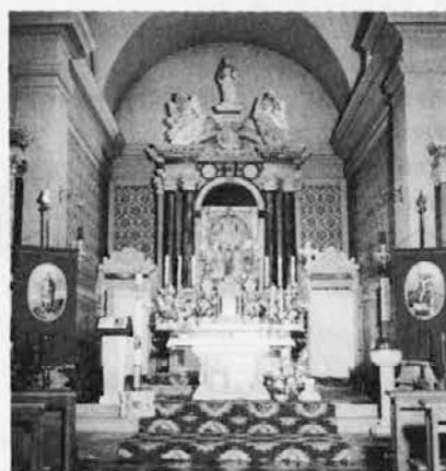
Glavni oltar v župnijski cerkvi v Podgori

Rožnovenska Mati Božja je poskrbela, da je bila nedelja lep sončen popoldan po hudih nalivih prejšnje noči in tudi vse jutro. Lepo vreme je pripomoglo, da se je tradicionalna procesija nemoteno razvila po podgorski vasi. Nabrežinska godba je za križem vso pot razveseljevala s koračnicami na znane viže slovenskih pesmi; tudi po končanem blagoslovu v cerkvi je na trgu pred cerkvijo odigrala nekaj klasičnih kosov iz svojega repertoarja v veselje udeležencev, ki so številni prihiteli počastiti Mater Božjo tudi iz mesta.