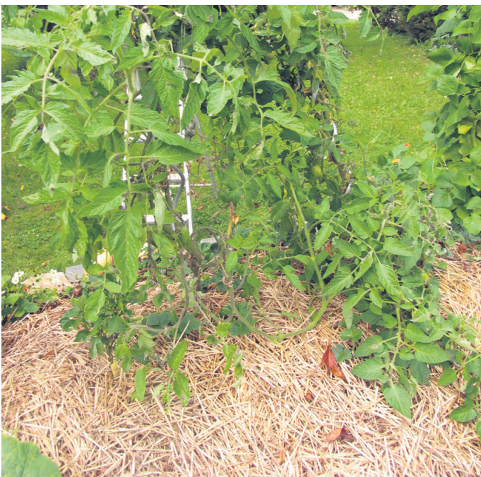
Zastiranje tal s slamo je izredno primerno spomladi in jeseni.

Naravne zastirke so lahko suhe – slama ali seno, sveže, kot je pokošena trava z vrta ali celo ovčja volna in njen izdelek agroflic. Slama ima velik pomen spomladi in jeseni, ko je hladno. Sonce čez dan segreje zrak v slami, ponoči pa se le-ta ohlaja in greje rastline. Poleti pa so sveže pokošene rastline primernejše, saj dodatno hladijo tla, obenem rastline tudi rahlo pognojijo. Hranila so že v sokovih