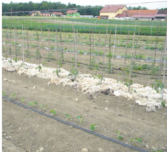
Zmagovalec med zastirkami je ovčja volna.

Ne smemo pa pozabiti, da danes že obstajajo biorazgradljive folije. Tudi za vrtničarje jih ima na razpolago Kmetijska zadruga Ptuj. V rastlinjaku bi jo zagotovo uporabila. Mogoče je od nje boljše samo ovčja volna. A ta ni vsakomur dostopna. Folija ima, vsaj v rastlinjaku, eno odlično lastnost. Preprečuje