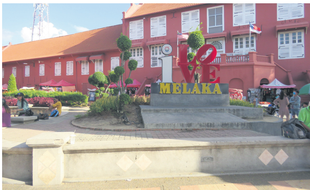
Utrinek iz Melake

Odpravila sva se na enega izmed njihovih postajališč, kjer jih je