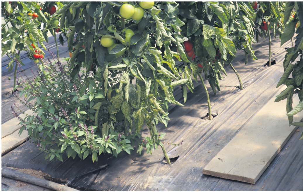
Folija je v rastlinjaku zaželeno, svetujem pa uporabo biorazgradljive folije.

Zdaj pa še odgovor na drugo vprašanje. Najpomembnejša funkcija zastiranja tal ni preprečevanje rasti plevelov. Čeprav seveda pride prav. Za zdravje naših rastlin najpomembnejša funkcija prekritih tal je skrb za zemljo. Zastirka poskrbi, da zemlje ne bičata dež in veter, da nanjo ne pripeka sonce. Tako ostaja ves čas rahla, zračna in s tem odlično okolje za korenine vrtnin in seveda v prvi vrsti mikroorganizmov. Zasenčena zemlja je seveda hladnejša. Ne najmanj