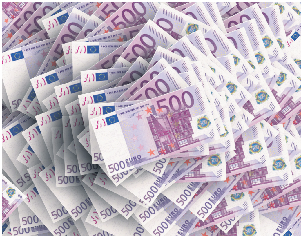
Leta 2018 je za plače v javnem sektorju šlo 3,88 milijarde evrov, v covidnem letu 2021 pa 5,13 milijarde evrov.

Za zadnje leto še ni popolnih podatkov. Do decembra lani pa je šlo za plače 4,5 milijarde evrov (v znesek še ni zajet mesec december), kar je sicer manj kot v letu 2021, a že presega maso plač