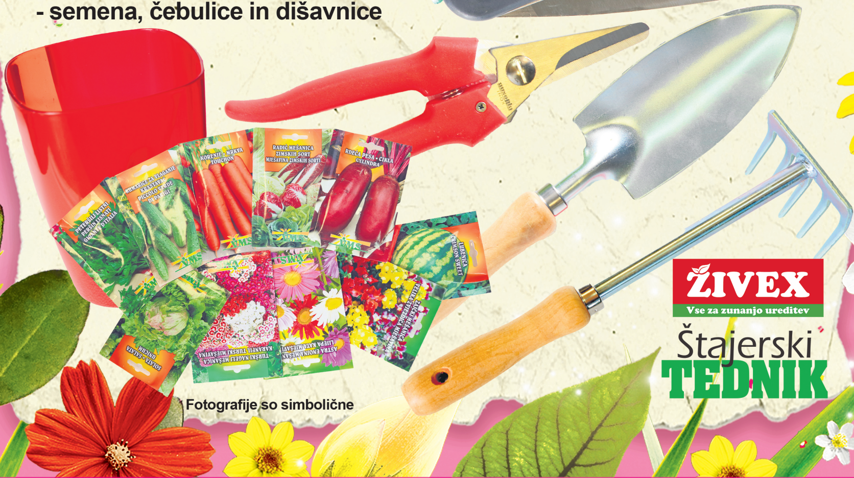
Fotografije so simbolične

ŽIVEX Vse za zunanjo ureditev Štajerski TEDNIK