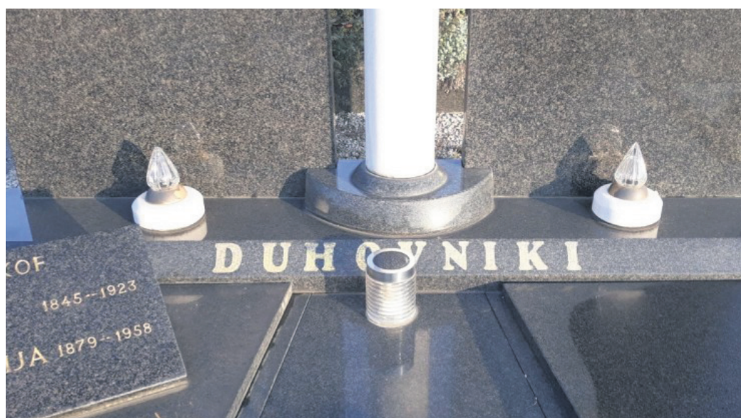
Na pokopališču v Cerkvenjaku je dobra desetina grobov opremljena z električno napeljavo, zato na njih v vsakem vremenu sveti električna večna lučka.