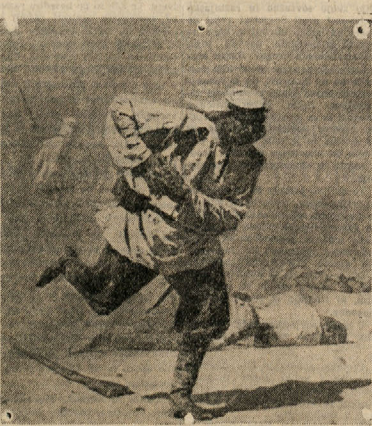
VEREŠČAGIN: «Smrtno ranjen...»

— Ves — vse na kupu, možje in konji, in sredi med njimi je bil v tistem črnem hrupu. Ziv, sinko, živ? — Jaz sem ga izmed vseh spoznal; oddalec, oddalec sem gledal ga, mama a kot da pod milim Bogom sva sama, tako sema ga izmed vseh spoznal. No, sinko, in kaj potem? — Potem je naenkrat pal z viška vznak. Joj — ali si videl prav? — In kakor oblak se je vse razbegnilo, moške in konji, vse drlo bogvekam; on sam je ostal sredi snega in jaz pri njem obraz v obraz. Obraz v obraz... Oho! Sinko — ta je pa bosar: saj si gledal oddalec samo! — O mama, kako si neumna: če pravim, da sam ne vem, kako! Saj res, saj res... moj Bog, vse kar mi čebijaš, so same sanje,