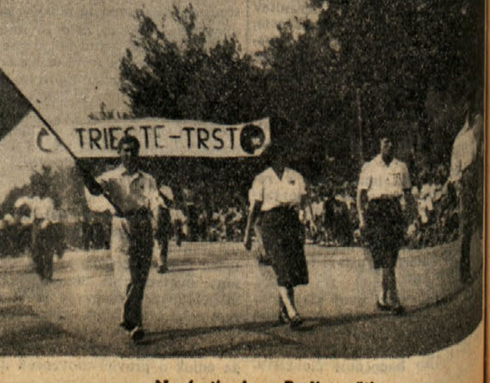
Na festivalu v Budimpešti...