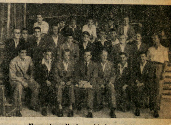
Novoustanovljeni pevski zbor v Križu

V Beli krajaji je bilo še leta 1228 mnogo poganstva. V Kobariču na Tolminskem so še leta 1331, po božje častili neko drevo ob svetem studencu in da so odpravili to staro navado, so morali drevo posekati in studenec zasuti. In končno — kdo ne pozna nešteti pravilje in pripovedk o vlah, rojencah, škrah, zakletih kraljicah, morskih deklicah itd. itd., ki so jih naši nonoti kaj radi pripovedovali ob dolgih zimskih večerih. Se živi vera v volkodlake, da še hudobnih ljudi, ki so se po smrti preselile v živali, predvsem v netopirje in sesajo živalim, pa tudi ljudje kril. In marsikdo, ki čita te vrstice, je trdno uverjen, da ga »amora tlačé« čí spi na hrbtu, ne zaveda se pa, da veruje isto, v kar so verovali naši predniki pred 1300 in več leti, ko jih je na to navajala njihova preprosta vera... BREJSKI