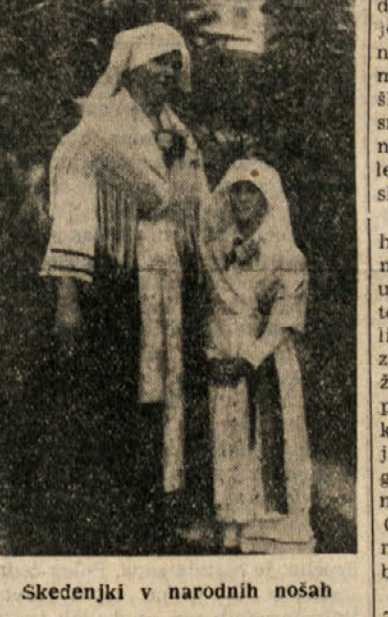
Škedenci v narodnih nošah

liči vasi, koder je danes že pravo mesto. Baje so nekateri imeli nekaj navih celo v bližini današnje velikega trga. Mnogo škedenjskih navih je bilo na gricu Pantaleonu, dalje na Turkovcu v Pulju, Sobotnjaku in drugot. Pridelovali so večinoma koruzo, fižol in krompir. Imeli so tudi dobre vinograde in sadovnjake. Nekdanji Škedenci so živelj borno; privoščili so si nekaj priboljškov le za večje praznike med katere so pristevali tudi pust in običajno šagro. O pustu so pisali stiri dni zaporedoma in sicer v soboto, v nedeljo in ponedeljek ter na pustni terek. Zlasti lepo je bilo na pustni terek, ko so šli góci od hiše do hiše, za njimi pa veliko »škaramata« (sem). Nekateri »škaramata« so bile zares lepo opremljene in so večasih bile celo nagrajene. Mnogo lepše pa je bilo o tradicionalni letni šagri, ki se je navadno vršila drugo nedeljo po godu vaškega patrona sv. Lovrenca. Kot po drugih vaseh, tako so tudi v Škednju morala imeti vsa dekleta za šagro nove lepe obleke. Ze dol-