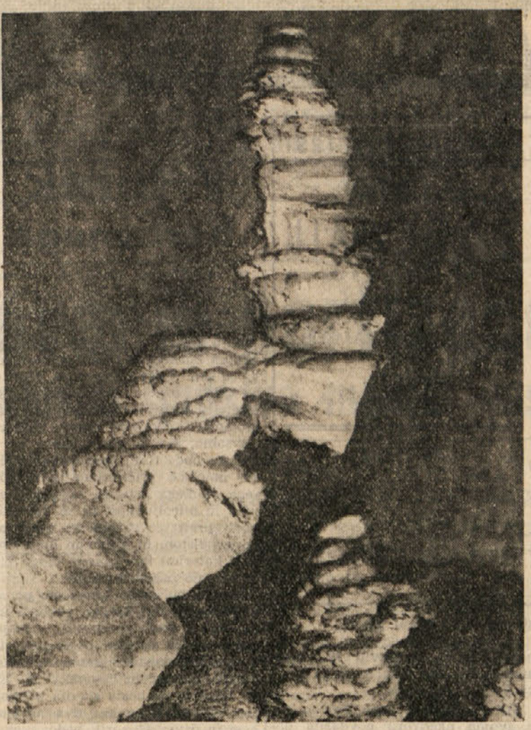
Prekrasno jamo v Briških ima še vedno v oskrbi »Societá Alpina delle Giulide. Od jame ima omenjeno društvo le koristi, ne da bi najmanj skrbelo za njeno potrebno ureditev in oplešanje. Nujno je, da se to podzemsko bogastvo resno zaščiti ter, da preide v občinsko upravo, kar zahteva SIAU s svojim volivnem programom»

«Tu es petrus et super hanc petram edificabo ecclesiam meam. Po naše se to glasi: Ti si skala in na to skalo bom sezidal svojo cerkev...» «Ta rek, ki ga je baje Kristus izrekel svojemu apostolu Petru, je za papeštvo globoka pomena, kot se običajno misli. S tem rečenico je papeštvo delovalo že od svojih prvih početkov po priznanju krščanske vere po rimskem cesarju Konstantinu. In to v dve smeri: v imperialistični in v reakcionarni, v imperialistični in v reakcionarni...»