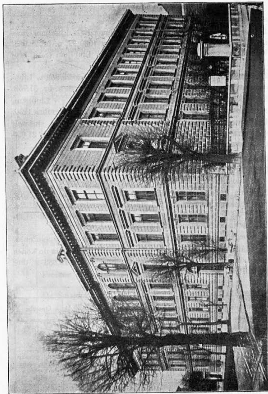
Šolsko poslopje obeh državnih učiteljskih.