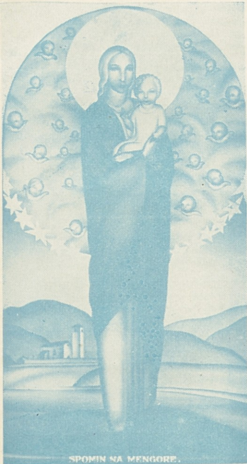
SPOMIN NA MENGORE.

SHOD V LOURDU SE BO VRŠIL 19. MAJA Z ZAČETKOM OB 15.30 V VOTLINI. PRINESITES S SEBOJ KNJIŽICE.