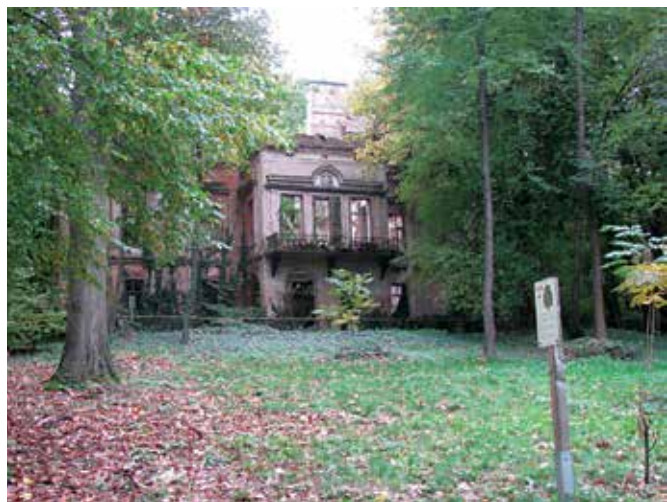
Okoli dvorca Matzenau poteka tudi krožna gozdna učna pot. Prosenjakovci, 12. 10. 2013

Na njem je 21 slovenskih in tujih znanstvenikov razpravljalo o kulturnem, družbenem in naravnem okolju Prekmurja. Z vidika estetskih elementov kulturne krajine, lokalne tra-