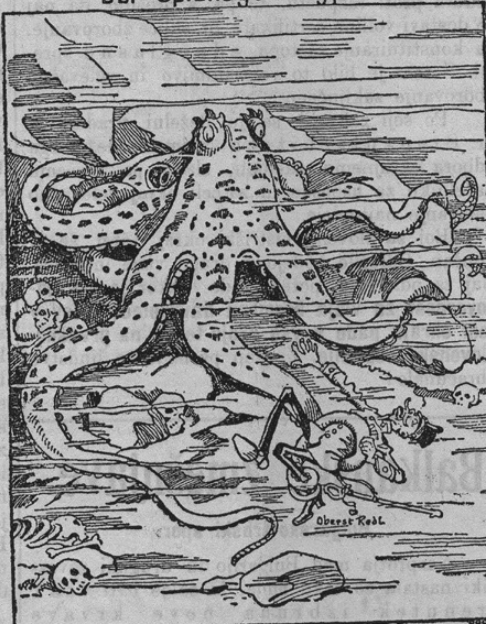
Wie viele werden dem Ungeheuer noch zum Opfer fallen?