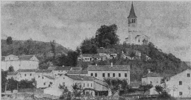
Župna cerkev v Trnovem

Po Salomovi odpovedi so se pričeli za prosto župniško mesto potegovati številni pro-