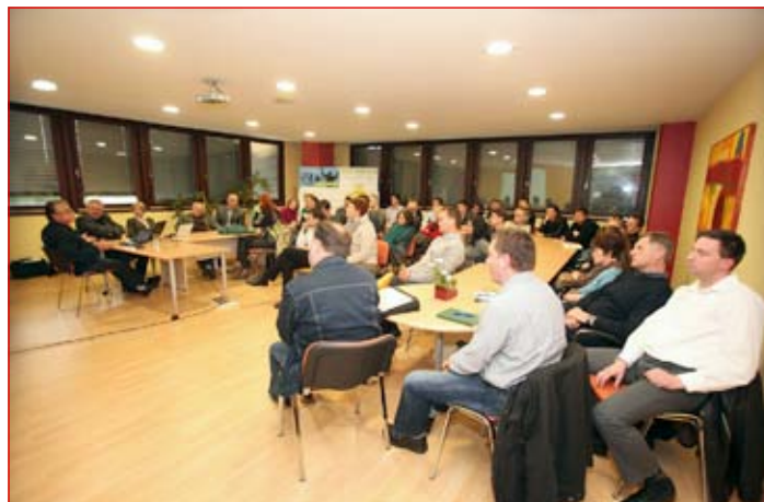
Manager klub Ptuj, ki je lani praznoval 20. obletnico, je v prvi polovici leta pripravil lepo število predavanj. Na fotografiji utrinek s predavanja Od inovacije do izdelka.