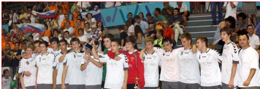
Na mednarodnem pokalu Granollers 2012 v Španiji je ekipa Spodnjega Podravja letnikov 1994/95 osvojila drugo mesto.