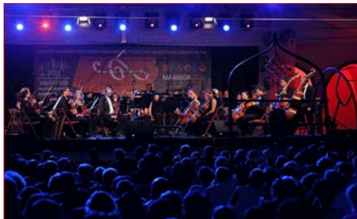
Koncert Donavske filharmonije 20. julija na dvorišču minoritskega samostana

Vox Arsana je energičen preplet vokalnega kvarteta in instru-