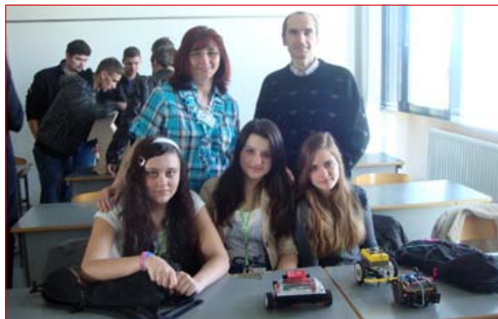
Dekleta so dokazale da tehnika ni samo za fante.

Svojo raziskovalno nalogo so dekleta predstavile učencem od