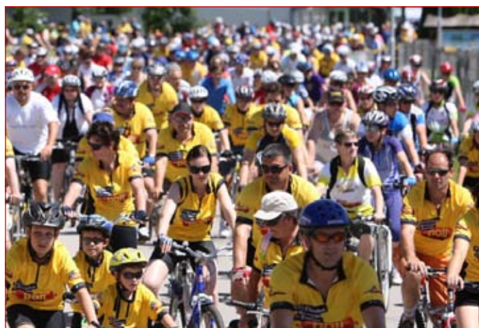
Na jubilejnem 10. Poli maratonu se je zbralo 5.750 kolesarjev, predvsem iz Slovenije, prišli pa so tudi iz Nemčije, Velike Britanije, Kanade in Hrvaške.

in tudi iz Nemčije, Velike Britanije, Kanade in Hrvaške.