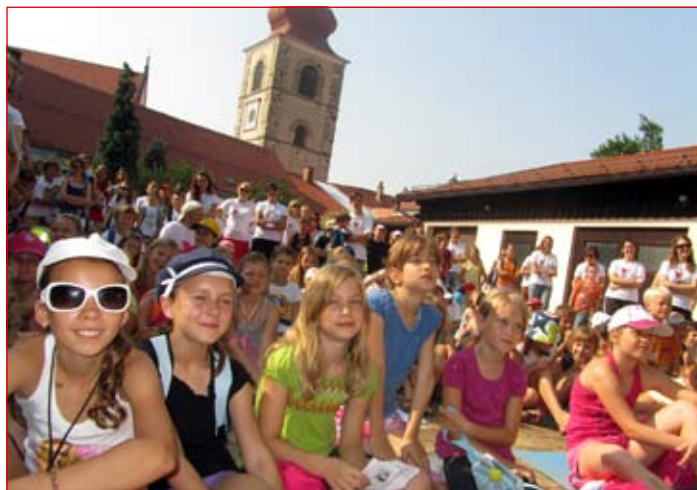
Oratorijski dan se je začel dopoldan, ko so se otroci zbrali na proštijem dvorišču, kjer so prisluhnili jutranjemu programu na odru.

Za otroke so po kosilu pripravili dvanajst delavnic: športne in družabne igre, izdelovanje mozaikov, oblikovanje iz glin in slanega testa, kuharsko in glasbeno delavnico, lov na zaklad po Ptuju ter vožnjo s Čigro po Dravi. Predšolski otroci, ki so bili del malega oratorija, so se ob popoldnevih podali na izlete (na ptujski grad in v mestni park, obiskali so Ptujске pekarne in slaščičarne), trinajst- in štirinajstletniki pa so se že pripravljali, da bodo enkrat tudi sami animatorji. Med drugim so pripravili igro, ki so jo predstavili