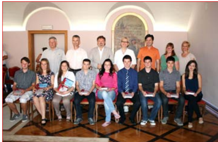
Najuspešnejši dijaki srednjih šol in ravnateljci oziroma namestniki ter župan.