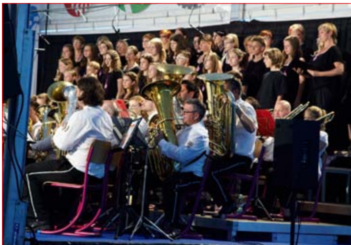
Kulturni program je ob dnevu državnosti zasnoval Pihalni orkester Ptuj.