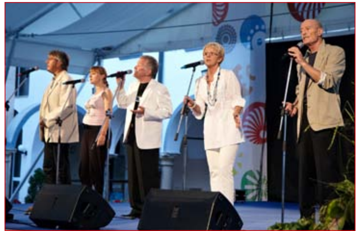
Legendarna slovenska skupina Pepel in kri

Stiske družin in posameznikov, ki so odraz gospodarske krize, so zarezale vse globlje v našo družbo in vse več je takih, ki brez pomoči več ne morejo preživeti. Številne dobrodelne organizacije tako pomagajo po svojih močeh, združene skupaj pa so tudi letos poskrbele, da bodo z izkupičkom