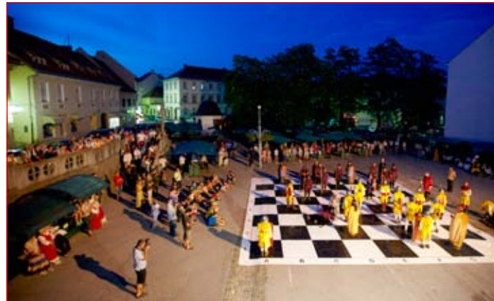
Srednjeveški živi šah na mestni tržnici je bil res prava atrakcija letošnjih grajskih iger.

ležili tudi Srednjeveškega dneva v Žužemberku, konec avgusta pa bodo sodelovali na Renesančnem festivalu v Koprivnici.