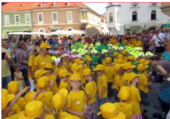
Na pohodu po mestnih ulicah se je sprehodilo več kot 200 minimaturantov Vrta Ptuj.