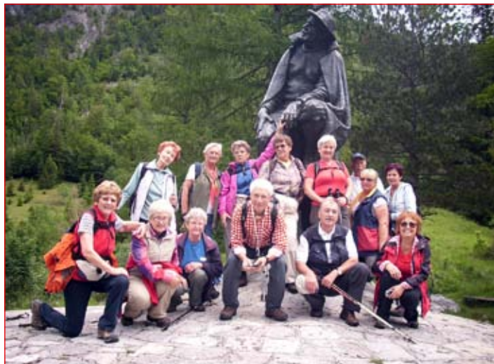
Na pohodu v dolino Soče, letos v juniju, pred spomenikom Juliusa Kugyja, zazrtega v Jalovec. Kugyjeve spomenik se nahaja ob pričetku vzpona po cesti iz Trente na Vršič.

dobrih jedi, predvsem pa so nekateri pravi mojstri v pridobivanju žganja in pridelavi vrhunskih vin.