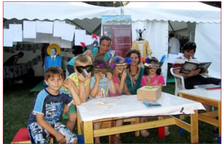
V Parku doživetij so pripravili 'grajske' delavnice, kjer so med drugim izdelovali kronice, ogrinjala in grajske obrazne maske.

Izvajajo jih v zbirkah muzeja ter v pedagoški sobi na ptujskem gradu. Pedagoške programe imajo pripravljene za svoje stalne zbirke in tudi za občasne razsta-