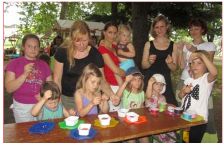
Otroci in odrasli so izdelovali afriški nakit.

Festivalsko dogajanje od 4. do 8. julija so letos iz Sončnega parka prestavili v park Ljudskega vrta na Ptuj. Za najmlajše