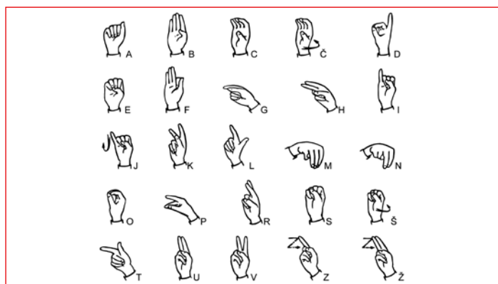
Znaki enoročne abecede

glede na plačano članarino. Z izvajanjem programov omogočamo gluhim, naglušnim in gluho-slepim ljudem enakopravnejše vključevanje v življenje in delo v družbi, kar je tudi v skladu z Akcijskim načrtom Sveta invalidov Mestne občine Ptuj, v katerem aktivno sodelujemo. Društvo je edina invalidska organizacija na območju svojega delovanja, ki