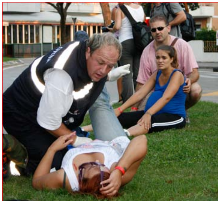
Člani ptujске ekipe so že večkrat uspešno nastopali na mednarodnih tekmovanjih.

Delo, ki ga opravijo bolničarji v pripravah za tekmovanje, ni le športni rezultat, saj je uporabna vrednost izražena v pomoči ob premnogi nesrečah. Okolje, ki