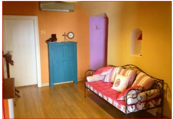
V Muzikafeju po novem tudi prenočišča