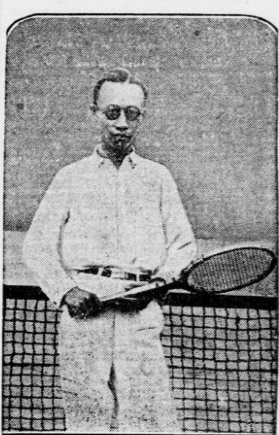
Mandžurski cesar Pu-Yi,

bivši kitajski cesar, velik prijatelj anglo- škikh navad, noče niti kot sportnik zaostati za svojimi evropskimi vzorniki in pridno bjeje teniške žoge z loparjem