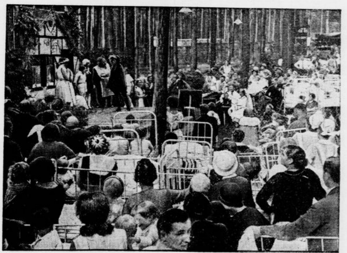
Kako lepo skrbijo za pohabljeno decu po svetu! V Berlinu imajo bolnico, kjer se lečijo in vzgajajo mladi pohabljeni. Otroci prireajo tudi gledališke igre, da je njih- ovim sotrpinom krajši čas