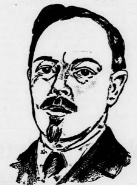
Londonški sovjetski poslanik Sokolnikov. Moskvska vlada mu je pripravila vodilno mesto v komisarijatu za vnanje zadeve