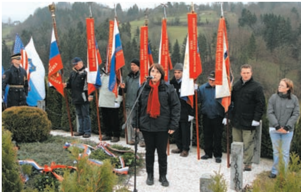
Ministrca Ljubica Jelušič je v svojem nagovoru poudarila, da si moramo vsi prizadevati, da bi vseh 192 padlih borcev v Zgornjem Tuhinju dobilo svoja imena.