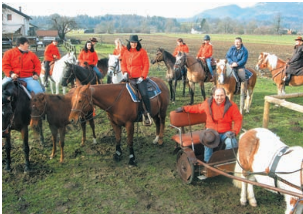
Konjeniki Kocjanovega hleva so se iz Stranj po blagoslov konj odpravili še na Zdušo k Reboljevi graščini.

Blagoslovljenih je bilo 41 konj; na nekaterih jezdec, drugi so bili vpreženi v zapravljičke, vozove lojtrnike... Tuhinjski konjerejci zelo lepo skrbijo za podmladek, saj svojo ljubezen do konj prenašajo na otroke in vnuke, tako je bilo v sprevodu na vozovih in na