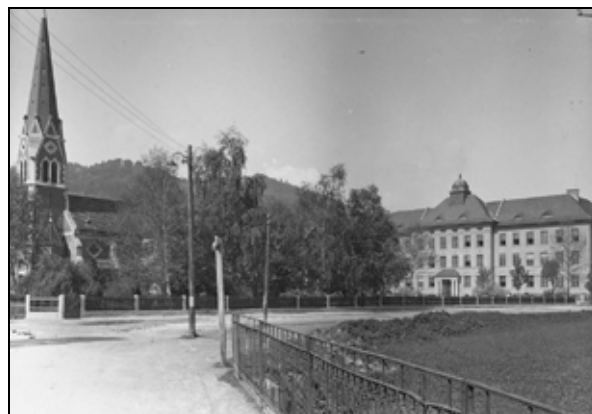
Poslopje I. gimnazije pred drugo svetovno vojno

Okrožnica št. 80, 14. januar 1938 (sign. 71/204): " Po čl. 2 pravilnika o pobijanju komunistične in druge