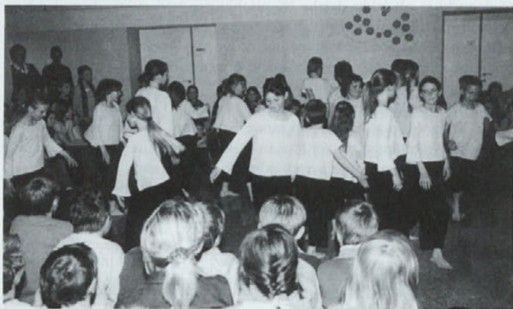
Utrinek s proslave

posebej, če se med nami dobro počutijo, radi prihajajo v šolo in se pridno učijo. Mislim, da so naši otroci takšni. Nenazadnje so nam to pokazali rezultati drugega ocenjevalnega obdobja, saj je uspeh okrog 98-odstoten. Pa ne samo učni uspeh, tudi rezultati na tekmovanjih so vzpodbudni. Imamo veliko učencev, ki so se uvrstili na državna tekmovanja. Pa ne samo letos, vsako leto imamo učence, ki osvojijo zlato priznanje na tekmovanju v znanju, imeli smo državne prvake v športu. Ponosni smo na njihove