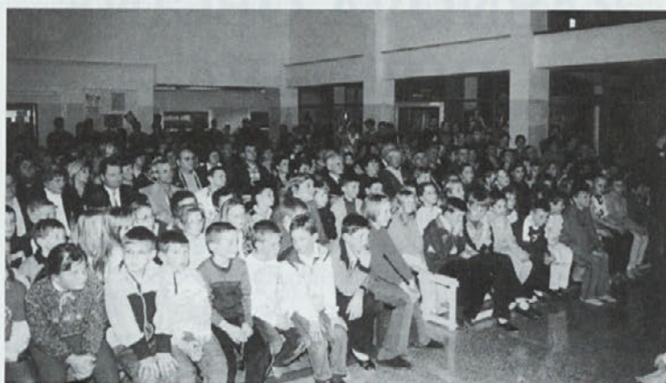
Obiskovalci so napolnili avlo

rezultate, na njihovo delo in trud. Vendar pa uspehov ne dosegajo sami od sebe, potrebni jim vzpodbuda in podpora vas, dragi starši, predvsem pa kvalitetno in profesionalno delo strokovnih delavcev, ki z veseljem in strokovno opravljajo svoje poslanstvo - vzgajati in izobraževati mlade ljudi, in to od najmlajših v vrtcu do nekoliko starejših - osnovnošolcev.