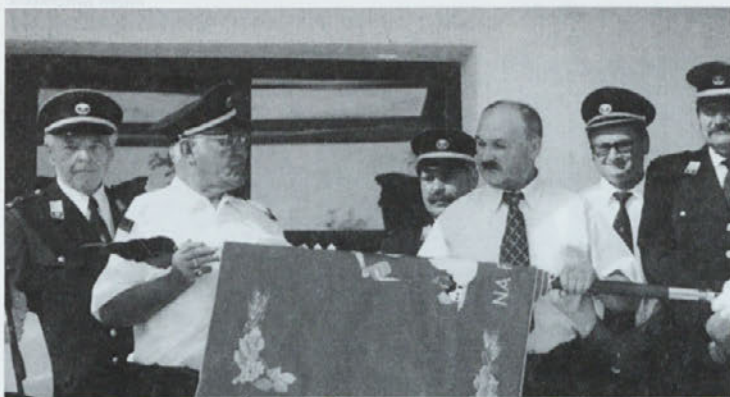
Razvijanje prapora v Žamencih

Gasilska zveza občine Dornava in Prostovoljno gasilsko društvo Žamenci sta v sklopu praznika občine Dornava izvedla praznovanje 6. dneva gasilcev GZO Dornava in 55. obletnice društva, ki je razvilo nov prapor - PGD Žamenci.